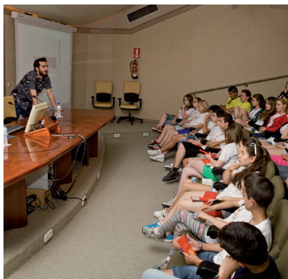
Patrimonio Joven, visita IPCE, 2012.