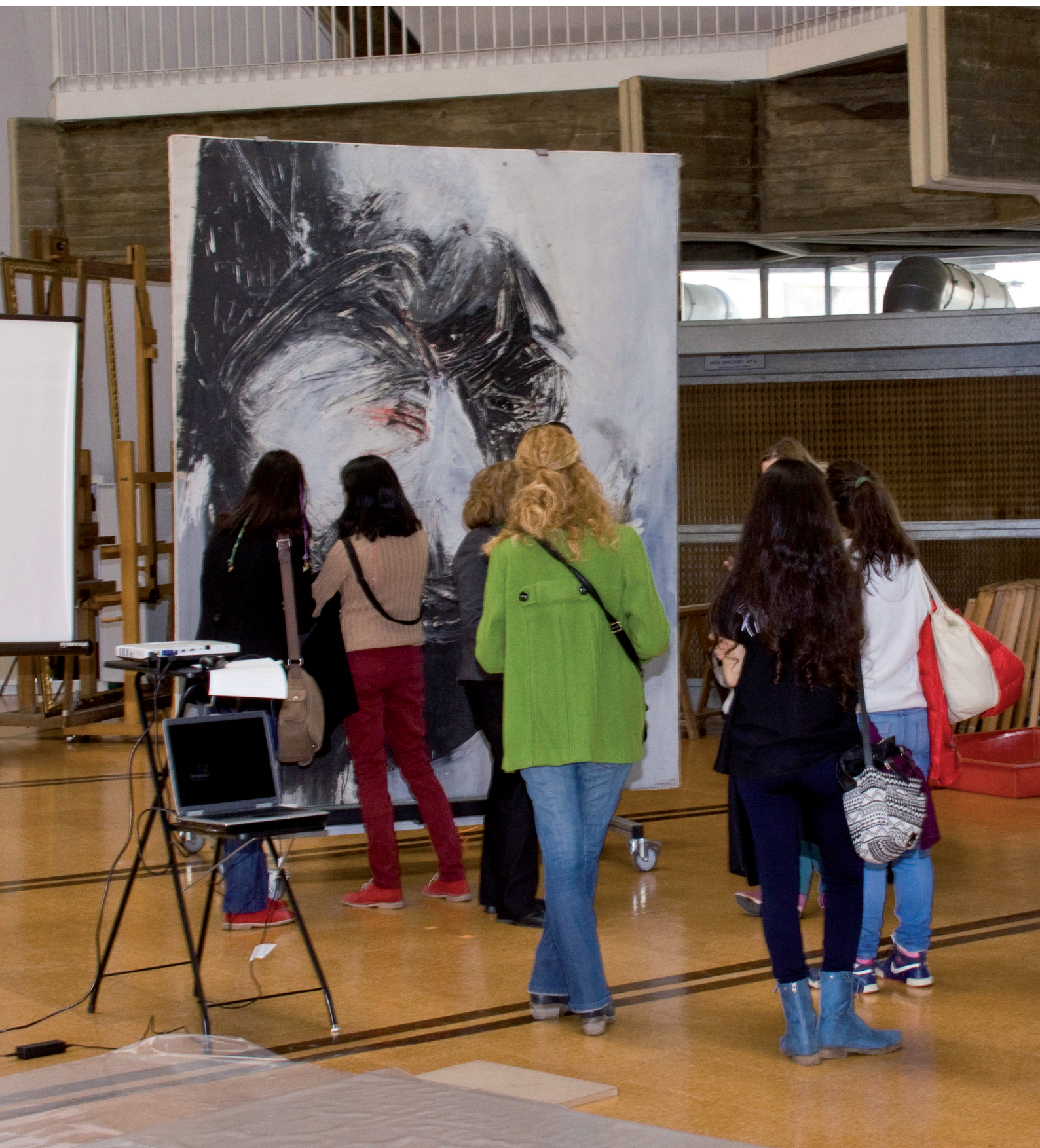
La pieza del mes IPCE, Canogar, 2013.