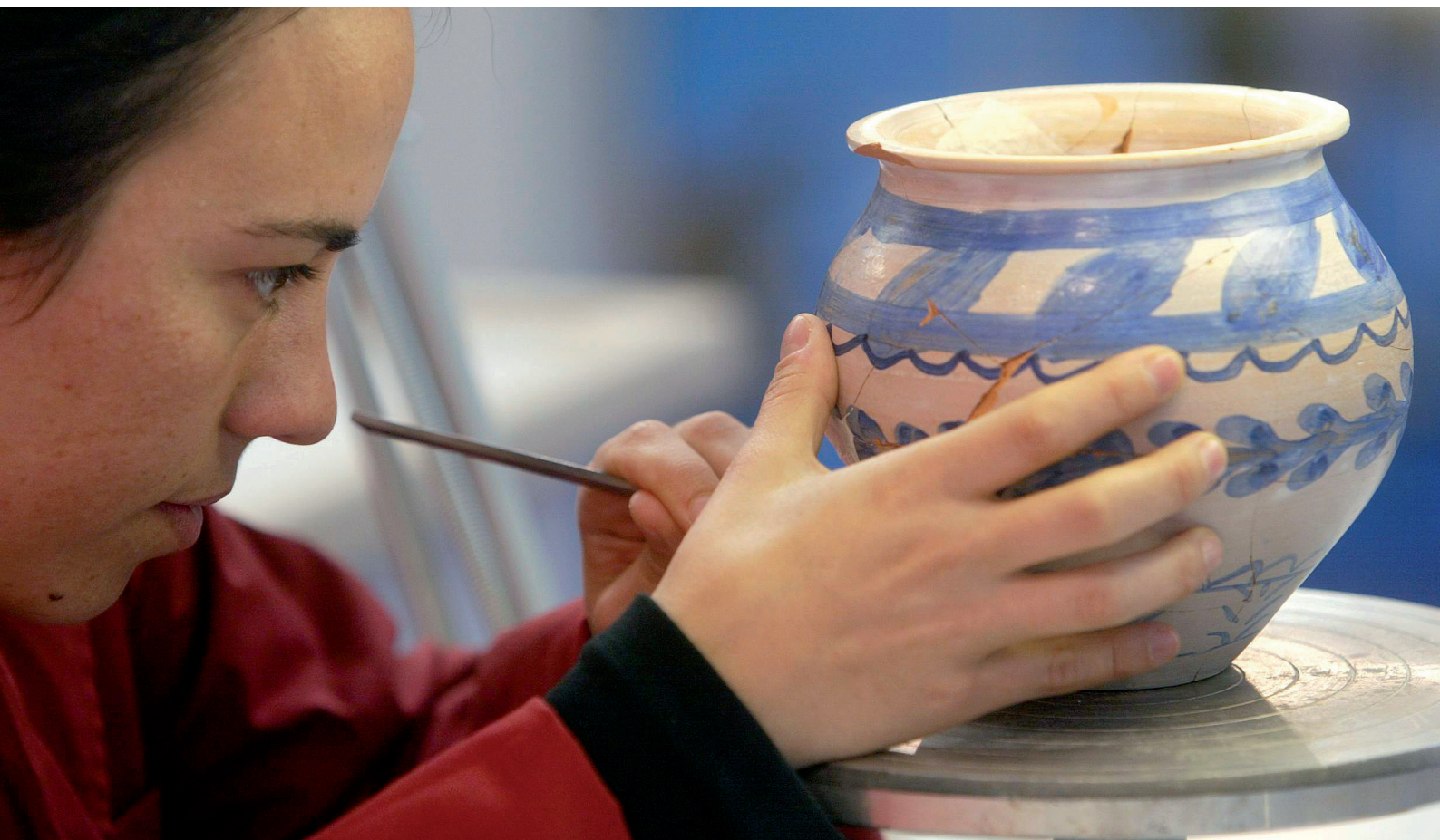
Actividad educativa en el museo Patio Herreriano de Arte Contemporáneo, Valladolid, 2011.