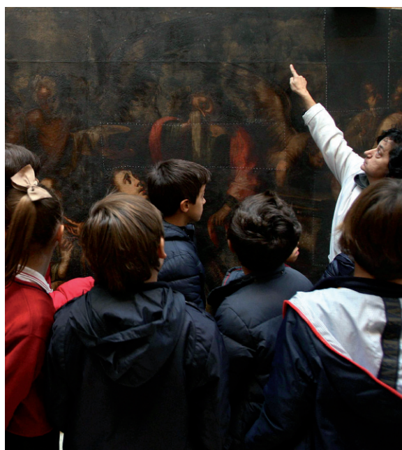
Visita didáctica del proyecto "Los lunes con Lorca" de la Junta de Castilla y León, 2012.