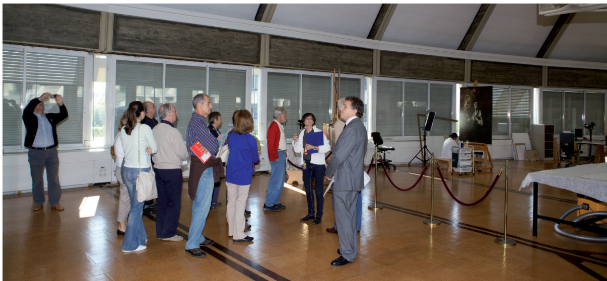
Jornada de puertas abiertas IPCE, 2012.

nivel educativo y del ámbito; no se contemplan tanto las técnicas y las actitudes, contenidos más propios del modelo centrado en el educando. El siguiente paso sería determinar cómo hacer accesibles y comprensibles estos contenidos, cuestión que desde la interpretación del Patrimonio se ha desarrollado ampliamente. Desde el modelo de didáctica patrimonial centrado en el contexto, lo importante es dónde tienen lugar los procesos de enseñanza aprendizaje, así como los elementos y factores que intervienen en dichos procesos, los niveles y capacidades del receptor, su situación y necesidades sociales, así como los propios recursos que el entorno ofrece.