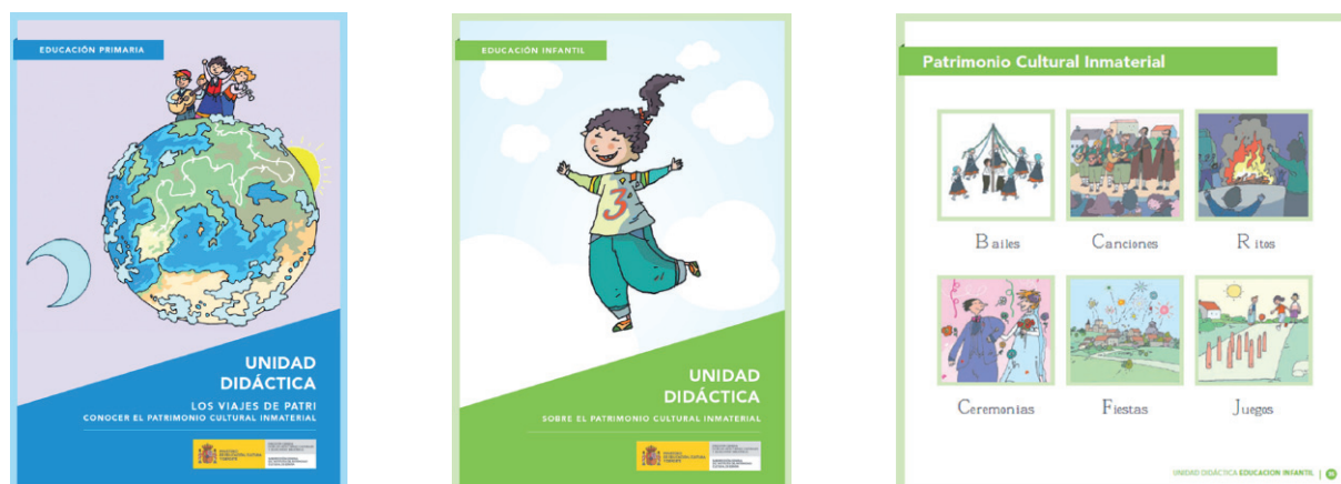
Unidades didácticas Patrimonio Inmaterial. 2014.