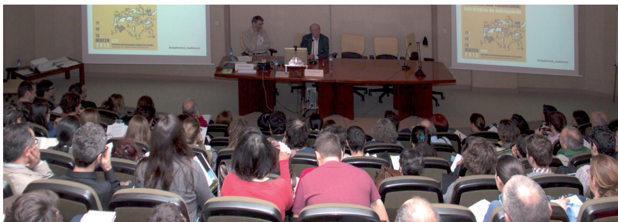
Jornadas sobre Arquitectura tradicional, 2015.

Asimismo, se debe impulsar la proyección de la comunidad científica en el ámbito internacional para dar a conocer los resultados de las distintas investigaciones y hacerse eco de los últimos avances en el ámbito internacional.