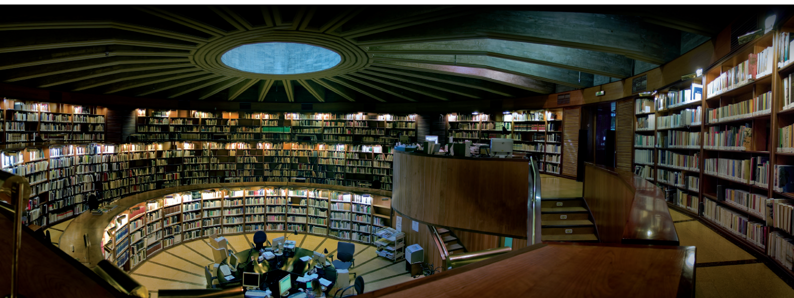
Biblioteca del IPCE. Foto: Jesús Herrero. Fototeca del IPCE. Archivo Herrero

til, primaria, secundaria, bachillerato, formación universitaria y profesional, esta base curricular no encuentra su adecuada implementación educativa dentro de la enseñanza formal. Este hecho es especialmente relevante ya que el aula es uno de los lugares donde los niños y jóvenes pasan más tiempo y donde se debe contribuir a sensibilizar y formar al alumnado para que sea capaz de desarrollar una actitud crítica y comprometida con los bienes culturales.