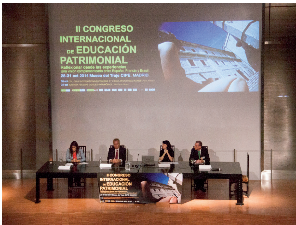
II Congreso Internacional de Educación patrimonial, 2014.

Deben establecerse parámetros (indicadores de calidad) que nos permitan determinar si un diseño se adecúa al contexto, si responde a los objetivos propuestos, si éstos son de naturaleza didáctica, si son alcanzables a corto y medio plazo, si se definen estrategias didácticas aplicables, si tiene una estructura flexible, capaz de recoger toda variable propia de la naturaleza cambiante intrínseca a todo proceso de enseñanza-aprendizaje o si es consecuente con los últimos avances en materia de gestión de Patrimonio, entre otras muchas variables. Todo ello nos permite evaluar la calidad de un diseño educativo.