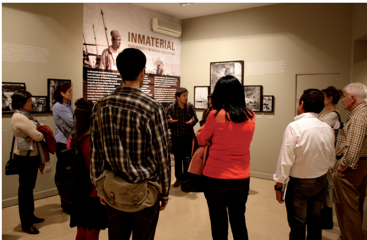
Visita en grupo a la exposición Inmaterial, 2014.

La actuación de la sociedad en relación con el Patrimonio no es la fase final de un proceso educativo, sino el origen del mismo. El Patrimonio no se difunde simplemente para que las personas lo conozcan; el fin de la educación patrimonial es que los ciudadanos sientan suyo ese Patrimonio, que lleguen a asumir que su identidad, en los diferentes niveles en que se configura, deriva de referentes patrimoniales que explican qué somos, cómo somos, por qué hemos llegado a ser así y cómo nos relacionamos con los demás. Separar el Patrimonio de las personas es disociar un binomio inseparable: el Patrimonio lo es porque existen personas que lo han generado, lo han cuidado, lo han transmitido y lo han puesto en valor.