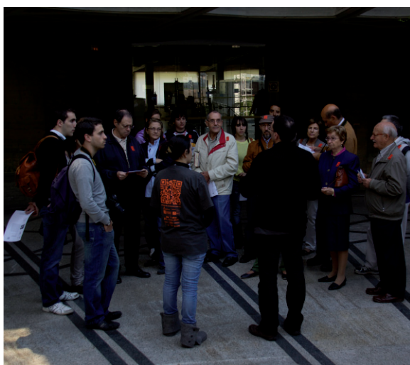
Jornada de puertas abiertas IPCE, 2012.