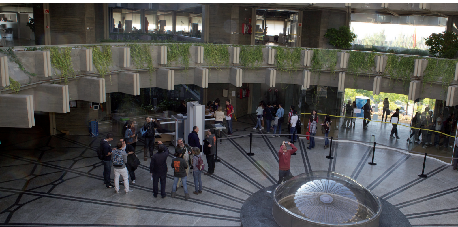
Jornada de puertas abiertas IPCE, 2012.

Los distintos agentes implicados en el tratamiento comunicativo y educativo del Patrimonio tienen como objetivo común conectarlo con los ciudadanos. Por eso es muy importante que todas las acciones destinadas a este fin estén coordinadas, de modo que exista una economía en la gestión educativa del Patrimonio capaz de evitar duplicidades, que permita sumar proyectos con fines próximos, rentabilizar las inversiones en actuaciones o generar proyectos más sólidos y que impliquen a todos estos agentes.