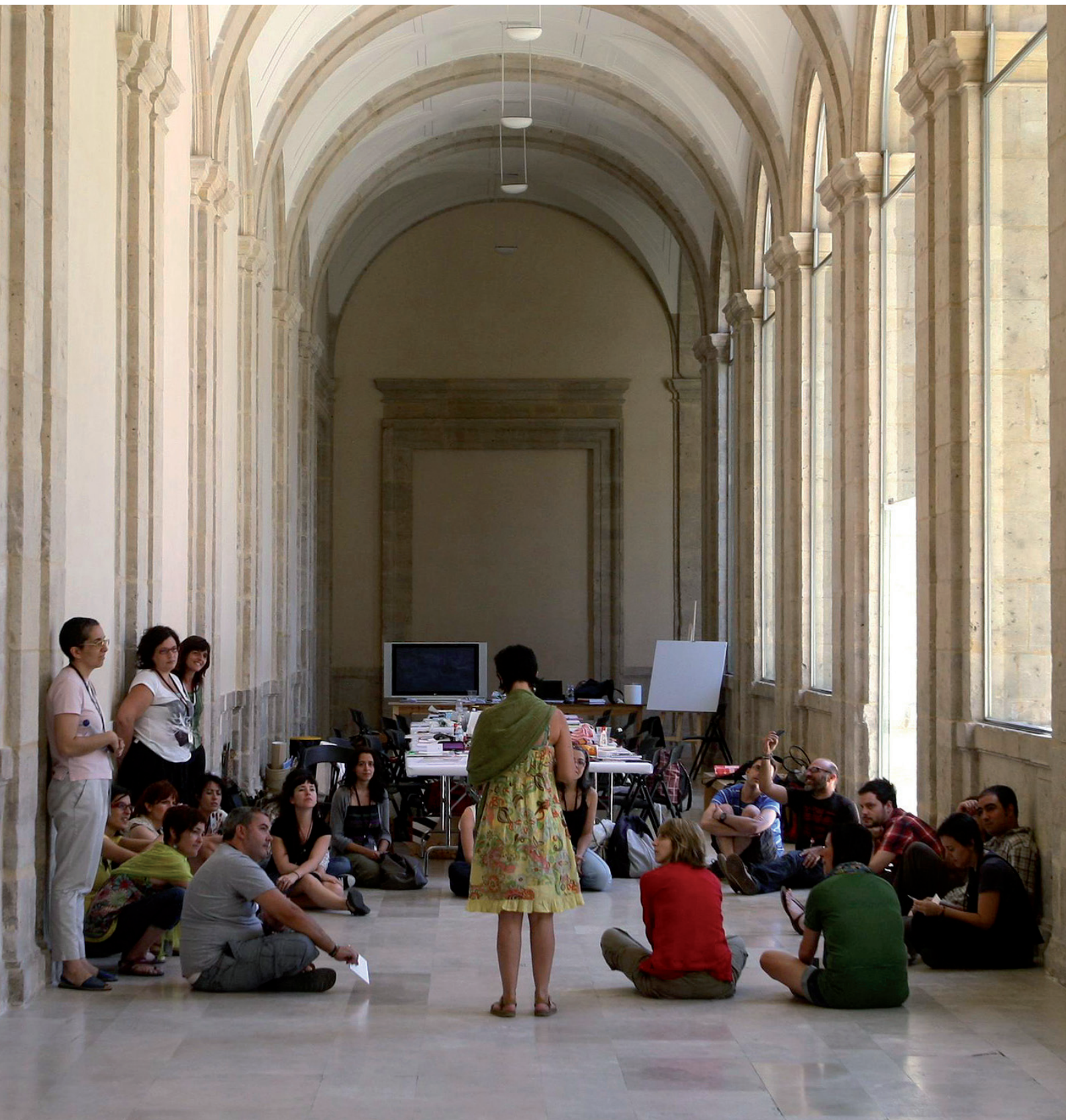
Actividad educativa en el museo Patio Herreriano de Arte Contemporáneo, Valladolid, 2011.