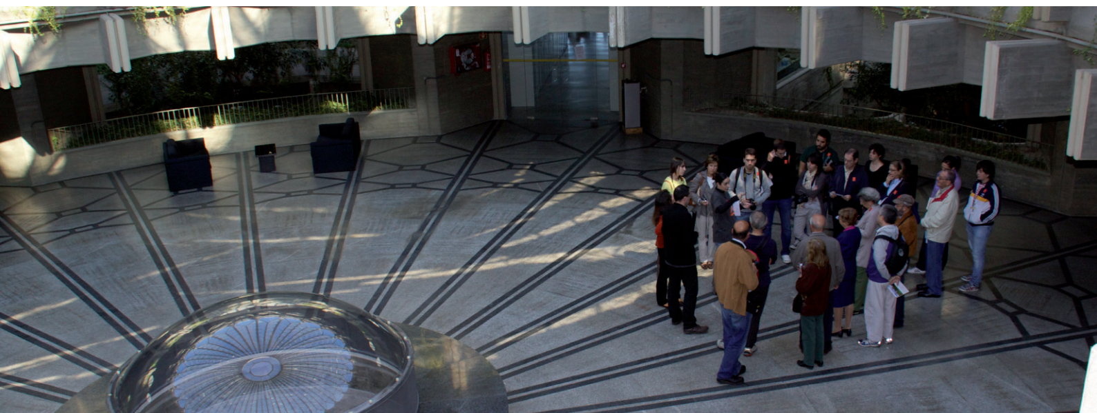
Jornada de puertas abiertas IPCE, 2012.