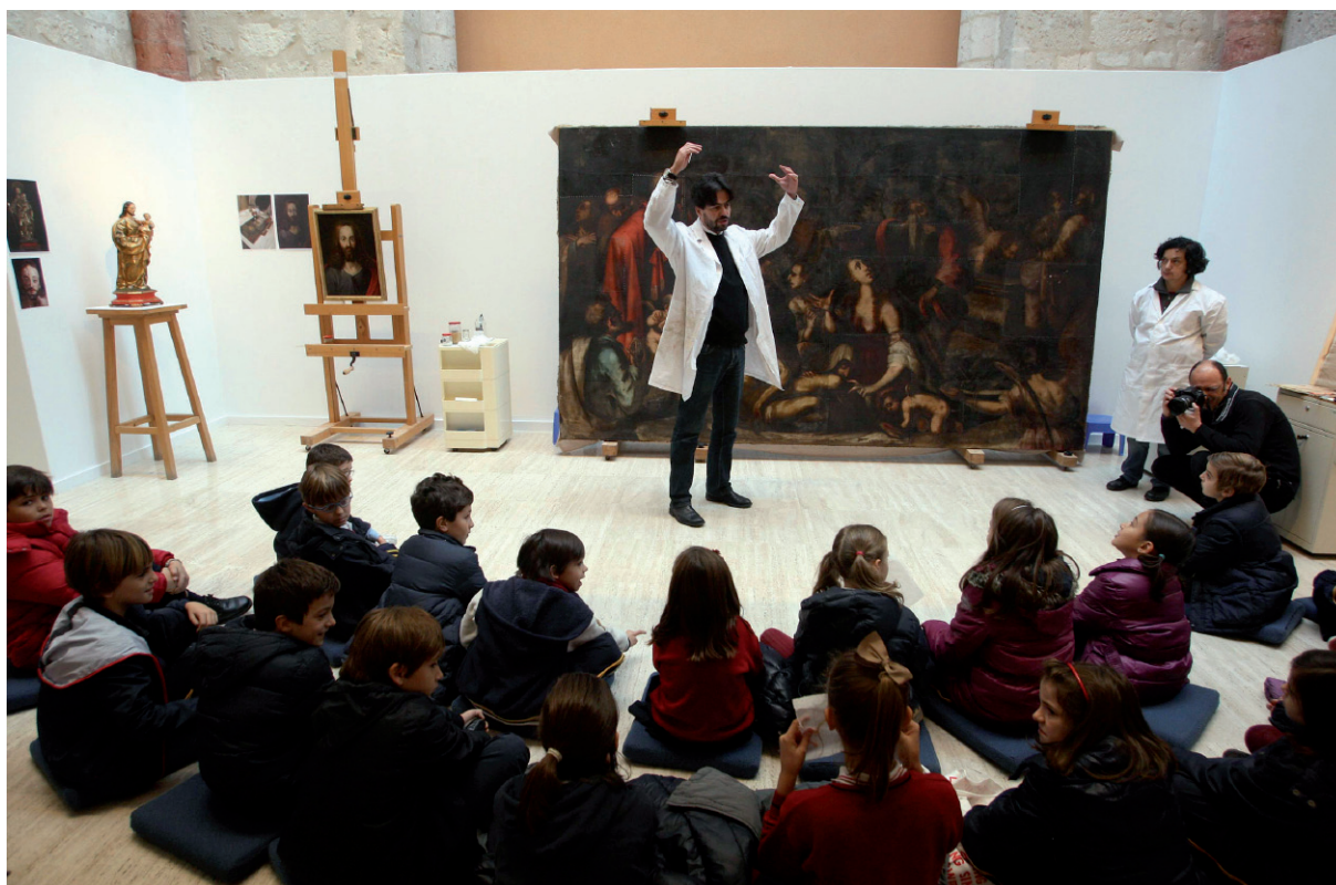
Visita didáctica del proyecto “Los lunes con Lorca” de la Junta de Castilla y León, 2012.