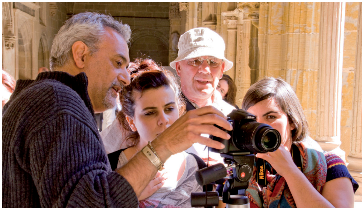
Curso de fotografía en la Escuela de Patrimonio Histórico de Nájera, 2013.