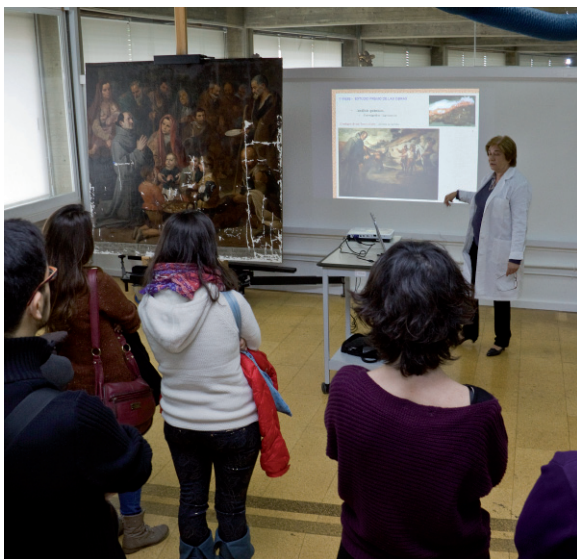
La pieza del mes IPCE, Murillo, 2013.