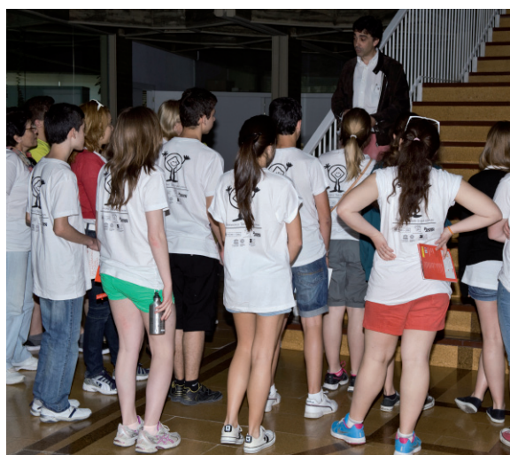
Patrimonio Joven, visita IPCE, 2013.