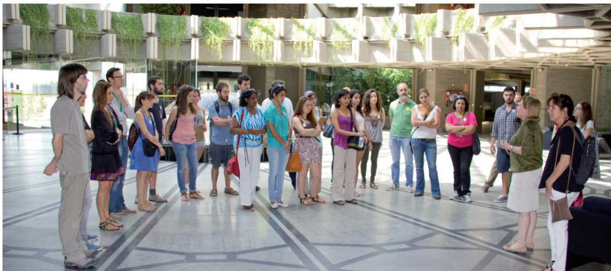
Visita guiada al IPCE, 2013.