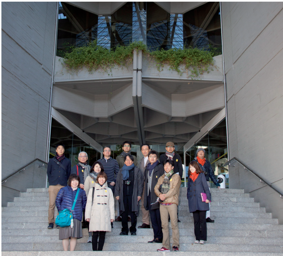
Visita guiada de arquitectos japoneses al IPCE, 2015.

el potencial educativo expuesto, así como su rápida integración en las dinámicas comunicativas cotidianas. Ahora bien, el planteamiento no es el de considerar la tecnología como fin, sino la tecnología como medio, como herramienta gestora de nuevos modelos educativos.