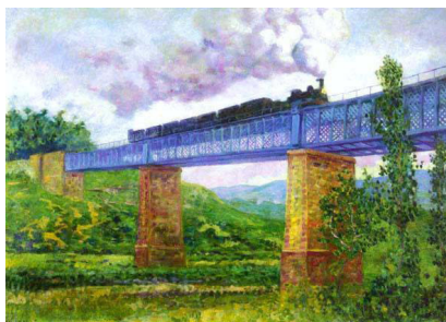
Dario Regoyos, El viaducto de Ormaiztegui.

Sin embargo, a partir de ese momento, el ritmo de crecimiento se ralentizó debido a las dificultades económicas del país, que se acrecentaron con la subida del carbón a causa de la I Guerra Mundial. El Estatuto Ferroviario aprobado en 1924 por la Dictadura de Primo de Rivera palió un tanto el problema: se concedieron ayudas financieras para la renovación de infraestructuras y materiales y se formalizó el aporte de capital público. Pero la crisis económica de los años 30 y la Guerra Civil provocaron la ruina total de las compañías privadas hasta que, en 1941, fueron absorbidas por RENFE, empresa pública que monopolizó el transporte ferroviario.