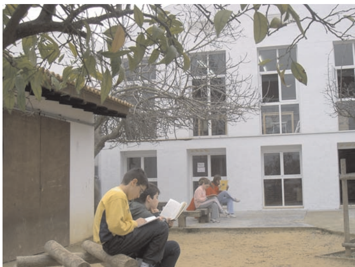
El edificio de las dos bibliotecas visto desde el jardín.