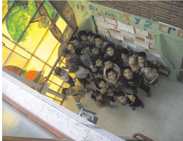
Exposición de trabajos del Día del Libro (vidriera)

Para terminar, nos gustaría destacar que la elaboración de este trabajo y sus implicaciones no hubiese sido posible sin la colaboración de toda la Comunidad Educativa. Un claustro implicado en cada una de las actividades y unas familias favorecedoras y colaboradoras con las mismas han hecho que este proyecto haya cogido forma y sentido a lo largo de nuestros años de labor educativa.