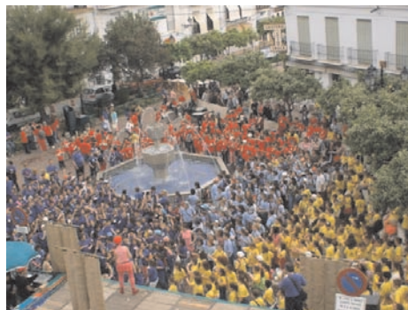
Encuentro Intercentro, todos los cursos de primaria del municipio celebran el día del libro con una gran fiesta en la plaza del pueblo. Los alumnos/as regalan un libro y reciben otro de alumnos/as de otros centros.