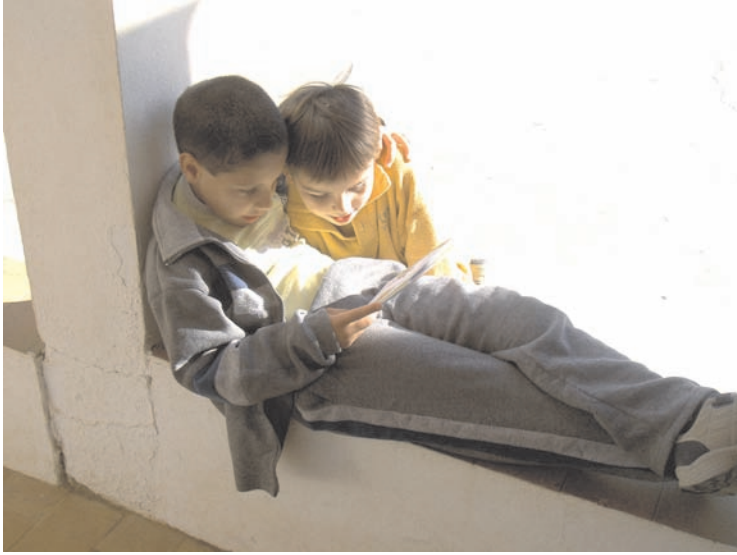
Amigos de los libros