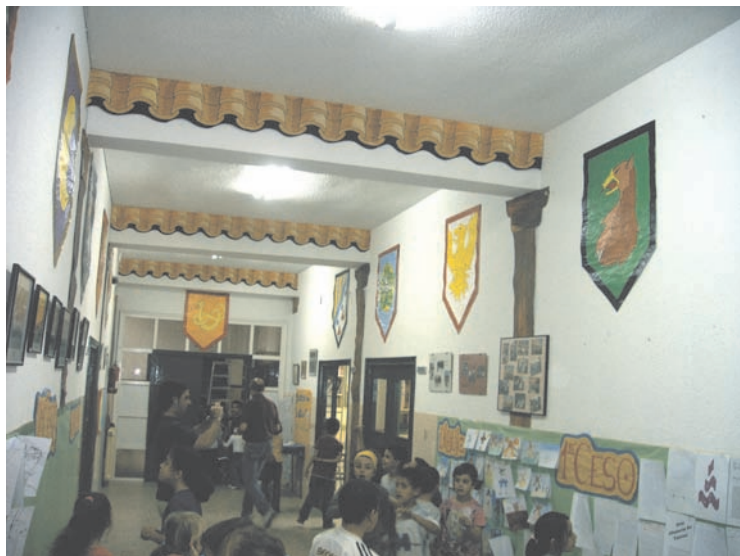
Trabajo sobre El Quijote en la Semana Cultural (pasillo secundaria)