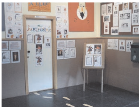
Bibliotecas Escolares y Perdayuri.

Se pueden estudiar en el centro los cuatro cursos de ESO, todas las modalidades de los Bachilleratos y Ciclos formativos de la rama de comercio: uno de grado medio (15 meses) y otro de grado superior, Gestión Comercial y Marketing (2 años). Existen también estudios en horario nocturno.