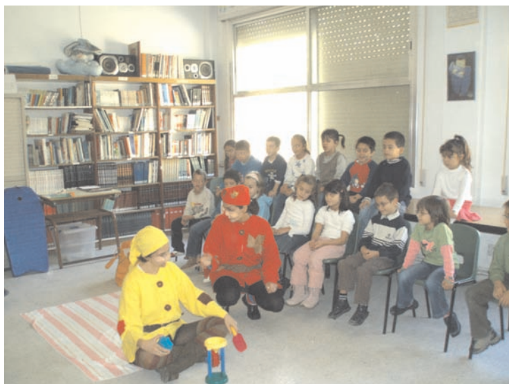
Animación del Otoño a alumnos de 2º EPO (Biblioteca)