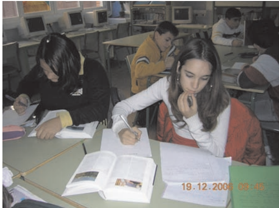
Autores: Gerardo Nieto Formariz, Beatriz Díaz Tejero, Antonia Álvarez Boza y Susana Moreno Alvarez

En nuestro método de trabajo han jugado un gran papel los proyectos de trabajo. Hemos trabajado en equipo, nos hemos propuesto y hemos logrado, aunque no siempre con el mismo éxito, la puesta a punto de la biblioteca como objetivo y recurso pedagógico.