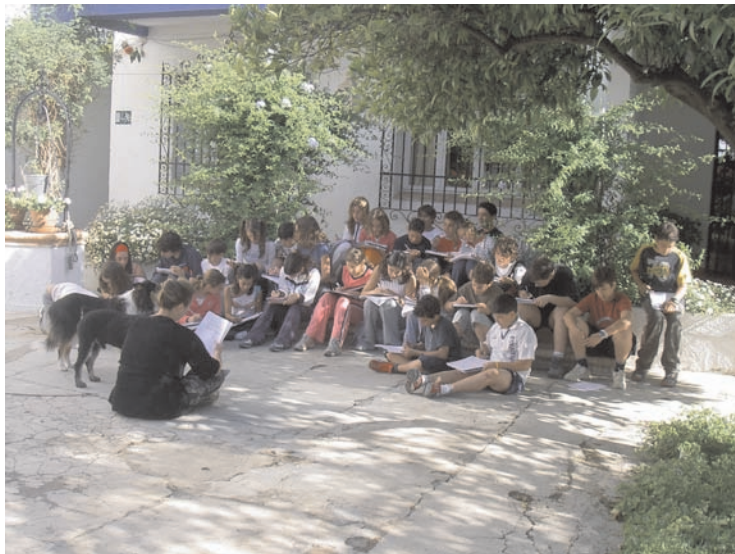
Grupos de alumnos y alumnas trabajando en el patio.