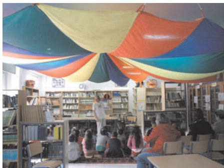
Encuentro con autor Pepe Maestro con su libro "El circo de Baltasar"