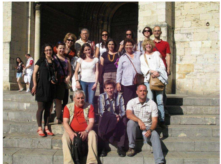
Algunos asistentes al paseo por la ciudad