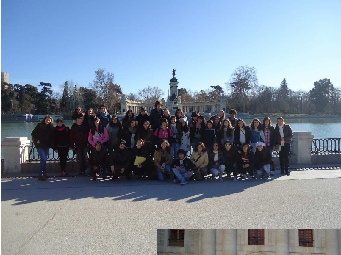
Los estudiantes en el Parque del Retiro y en el monasterio de San Lorenzo del Escorial (Madrid)