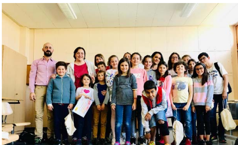
II Jornada suiza de lectura en voz alta. Programa "La magia de la voz" de la Consejería de Educación en Berna en la Agrupación de Lengua y Cultura de Lausana. Mayo de 2019. Aula de Écublens (Vaud)

En el Ticino, desde el nivel preescolar, la actividad semanal es de cinco días, de lunes a viernes, con una tarde libre el miércoles. En una parte importante de las escuelas hay jornada continua.