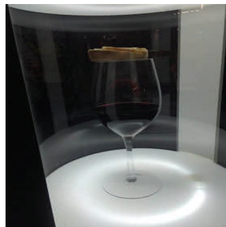
FOTOGRAFÍA QUE ILUSTRARÍA BIEN EL ORIGEN DEL TÉRMINO "TAPA" EN GASTRONOMÍA

EN HUNGRÍA, PARTICIPAN EN EL PROGRAMA DE SECCIONES BILINGÜES DE ESPAÑOL UN TO- TAL DE SIETE CENTROS DE EDUCACIÓN SE- CUNDARIA