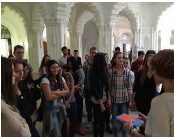
ALUMNOS DE ESPAÑOL DEL INSTITUTO KODÁLY ZOLTÁN, VISITANDO LA EXPOSICIÓN