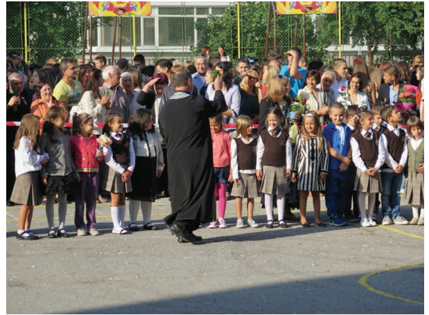
MOMENTO DE LA CEREMONIA DE APERTURA DEL CURSO ESCOLAR CON LOS ALUMNOS DE PRIMER AÑO

La apertura de curso es un día de gran importancia para profesores, alumnos y padres, que toman parte activa en la ceremonia, y en la que destacan las flores, la música y los bailes.