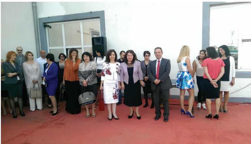
APERTURA OFICIAL DEL CURSO ACADÉMICO, LICEO TECNOLÓGICO "DOAMNA CHIAJNA"

El 14 de septiembre de 2015 hemos compartido la grata experiencia de la inauguración de curso escolar en el Liceo Tecnológico Doamna Chiajna, de la comuna Rosu.