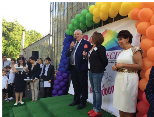
El Consejero de Educación, en la ceremonia de inauguración del curso en la escuela ESPA, de Sofía

La presencia de la Consejería contribuye a realzar y reconocer estos programas, así como a estrechar los lazos de cooperación entre las ambas instituciones.