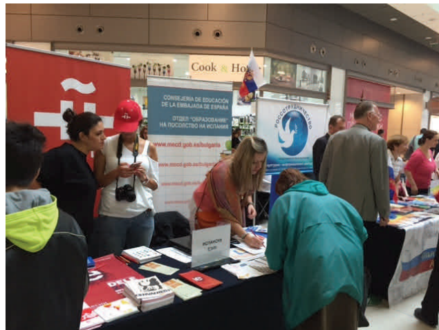
STAND DE ESPAÑA EN EL SOFÍA RING MALL

En este contexto, el sábado, 26 de septiembre, se celebró en el Sofia Ring Mall el Día Europeo de las Lenguas (EDL 2015), organizado por el British Council en colaboración con diversas embajadas _ entre ellas la española, representada para la ocasión por su Consejería de Educación y el Instituto Cervantes_ así como otras instituciones internacionales radicadas en Sofía, así como el Ayuntamiento de la capital.