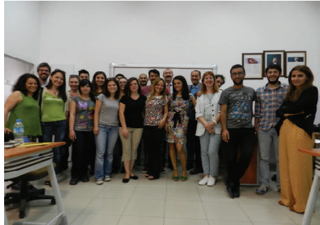
PANORÁMICA DE LOS ASISTENTES AL CURSO