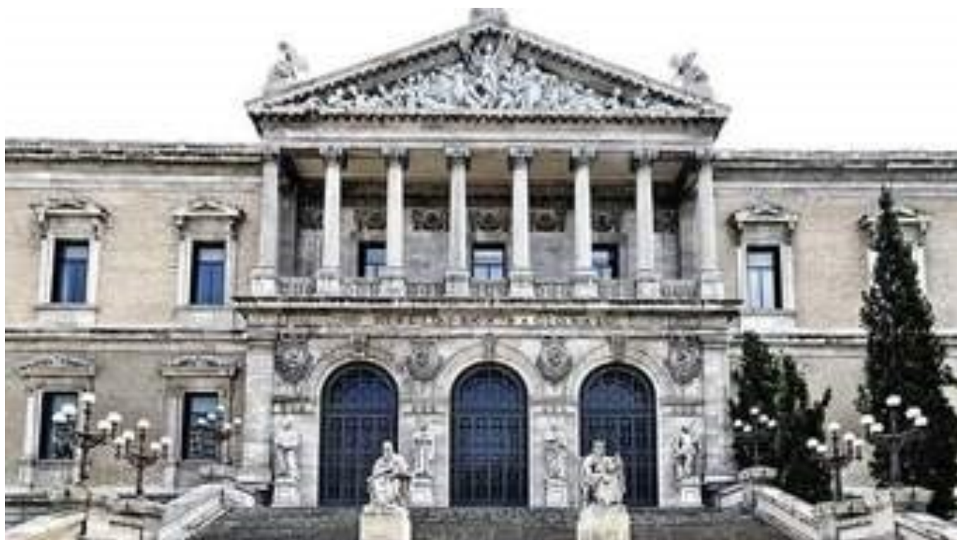
Biblioteca Nacional Madrid