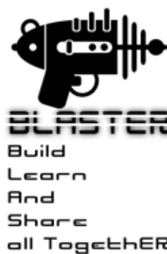
Logotipo del proyecto

Esta experiencia ha sido galardonada con el 1º Premio en la categoría FP modalidad A de los "Premios Nacionales a Experiencias Educativas Inspiradoras para el aprendizaje. Convocatoria 2022".