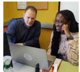
Evaluación con el profesor

Desgraciadamente este método no tiene en cuenta valores subjetivos como la usabilidad de la aplicación o el acabado estético. Tampoco tiene en cuenta factores sociales como por ejemplo la proactividad o la ayuda prestada a las compañeras y compañeros. Por ello esta calificación se tiene que tomar como una referencia objetiva en comparación con el grupo y debe ser ajustada a la alta o a la baja durante la segunda fase.