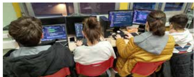
Alumnado desarrollando en grupo

La aplicación web blogBUSTER es el trampolín para desarrollar un proyecto más complejo, WildCart, que es una aplicación web de tienda online con dos perfiles y múltiples mantenimientos. WildCart es un proyecto que cubre todos los aspectos del aprendizaje del oficio. A partir de la especificación del proyecto se dividen las tareas entre los grupos de estudiantes, que toman como referencia el mantenimiento ya realizado en blogBUSTER y lo replican en el nuevo proyecto. Para la gestión de versiones utilizamos Git sobre GitHub. Los alumnos forkean y clonan el proyecto e integran en el proyecto principal mediante pull-requests , que equivalen a entregas.