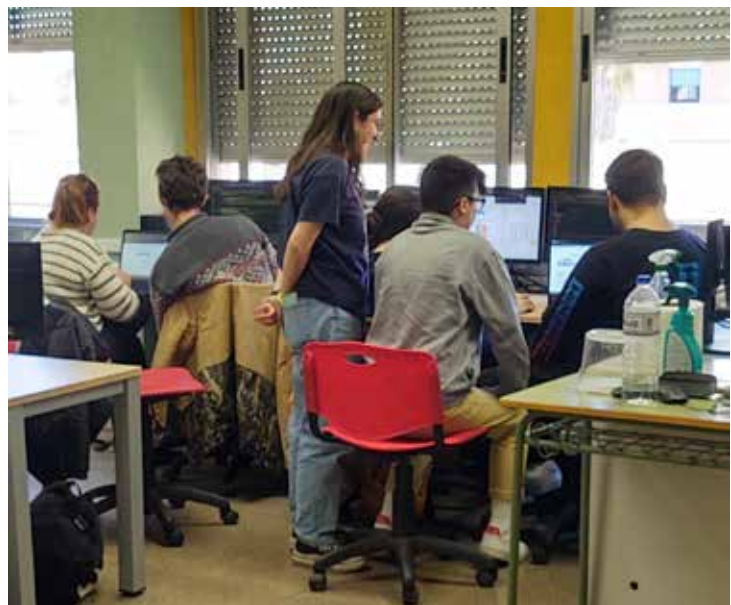
Desarrollo en grupo

Por otra parte, el profesorado ha de redefinir su rol. Tenemos una importante tarea de planificación del curso, especificando los proyectos para que sean asumibles por el alumnado. Al principio de curso es muy importante presentar la hoja de ruta a las alumnas y alumnos y que se comprometan con el estilo de aprendizaje. En las primeras semanas se debe partir de los conocimientos iniciales e ir afianzando contenidos muy básicos. A medida que pasa el tiempo, el profesorado cada vez utiliza menos tiempo de explicación, hasta que pasa a ejercer un papel de tutor de apoyo a los problemas puntuales que puedan surgir en sus proyectos personales durante la última parte de curso.