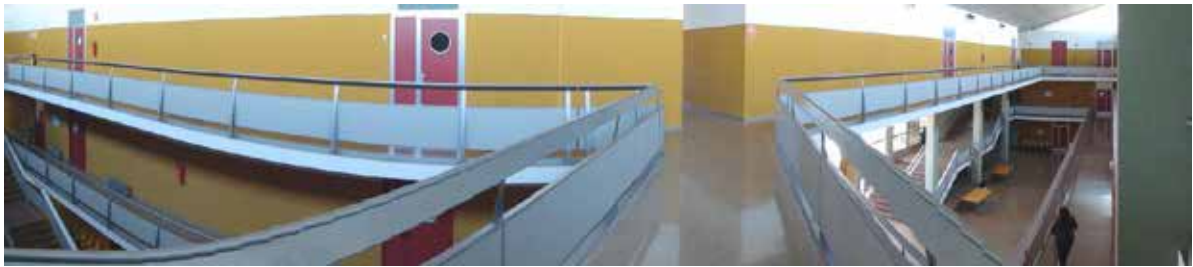
• Vista del CIPFP Ausiàs March

El proyecto BLASTER es una experiencia educativa que ha sido llevada a cabo en segundo curso del Ciclo Formativo de Grado Superior denominado Desarrollo de aplicaciones web (DAW), en el CIPFP Ausiàs March de Valencia, que actualmente cuenta con unos 27 ciclos formativos, 1600 estudiantes matriculados y alrededor de 140 docentes. En esta experiencia se propone capacitar al alumnado de DAW mediante ABP con los siguientes objetivos: