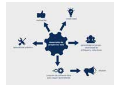
• Aprendizaje basado en proyectos