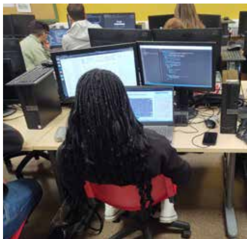
• Alumna desarrollando el proyecto individual

Al contrario de otras especialidades de FP, donde las 40 horas del Módulo de Proyecto en segundo curso pueden ser suficientes para desarrollar un proyecto, los proyectos de aplicaciones web mínimamente viables cuestan de desarrollar entre 200 y 400 horas como mínimo. Por esta razón es conveniente adaptar las programaciones en los módulos, para incluir durante la segunda evaluación el inicio de los proyectos que en junio se presentarán ante el tribunal para superar el Módulo de Proyecto. La experiencia es un éxito, ya que el alumnado dispone de más tiempo de tutorización, a la vez que les sirve para superar los contenidos de los módulos de segundo curso, y se benefician de todo el código generado por el profesorado y por los compañeros y compañeras dentro del proyecto WildCart durante la primera evaluación, ya que, como hemos dicho, se publica con licencia MIT.