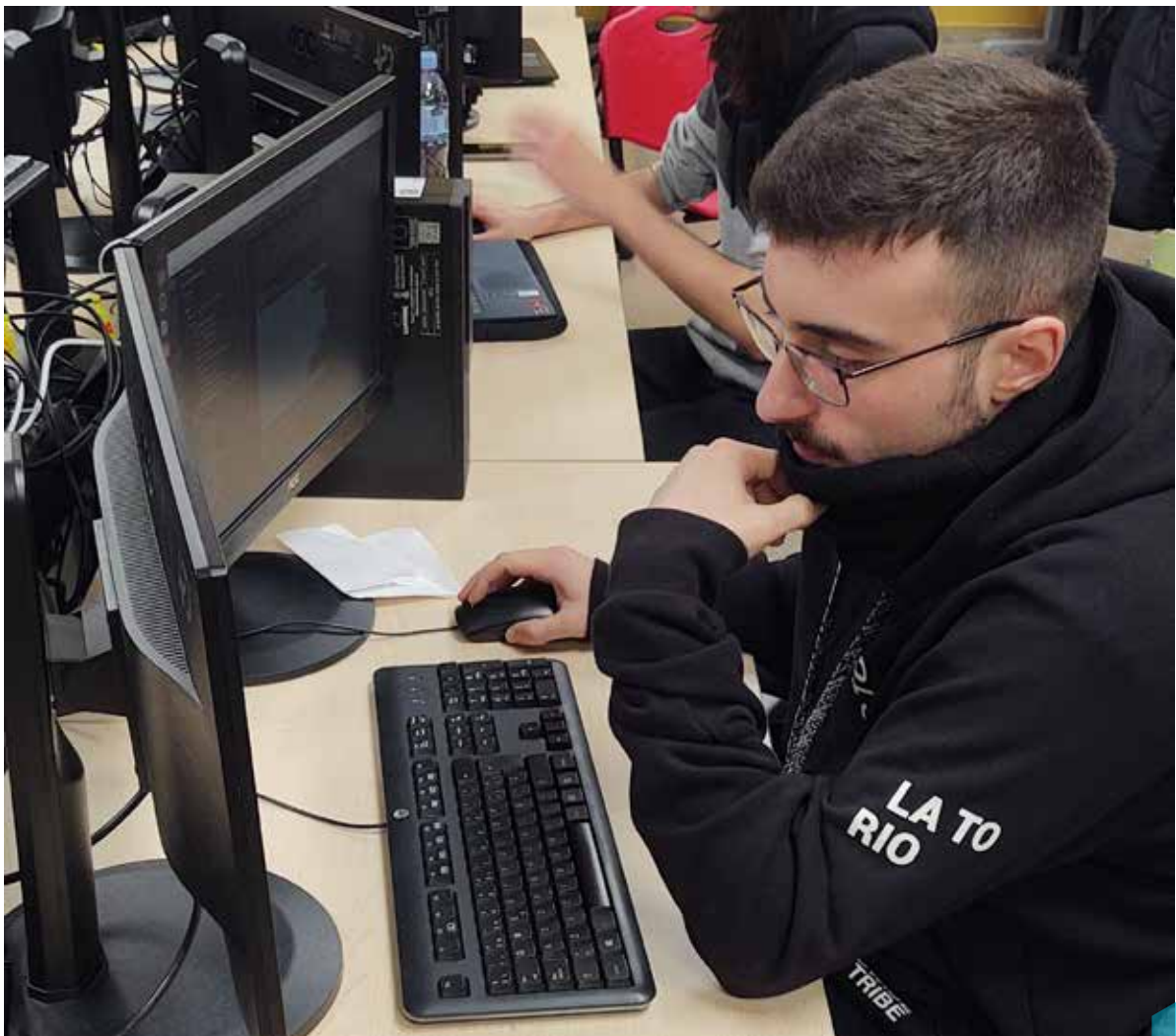
• Alumno desarrollando