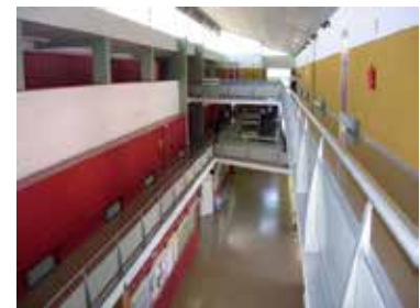
• Vista del CIPFP Ausiàs March