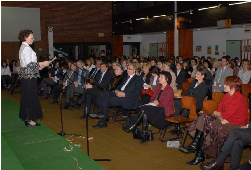
MAGYAR-SPANYOL KÉTTANNYELVŰ OKTATÁS 20. ÉVFORDULÓJA - 2008