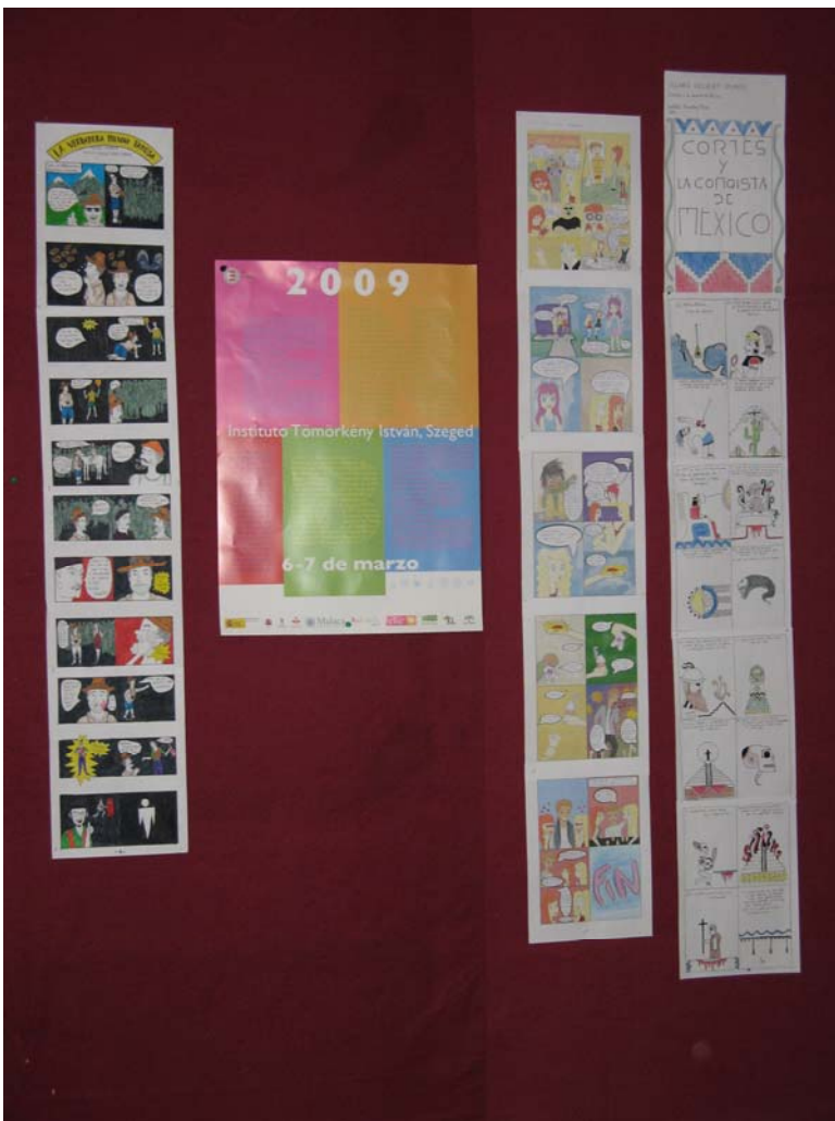
ENIBE - 2009