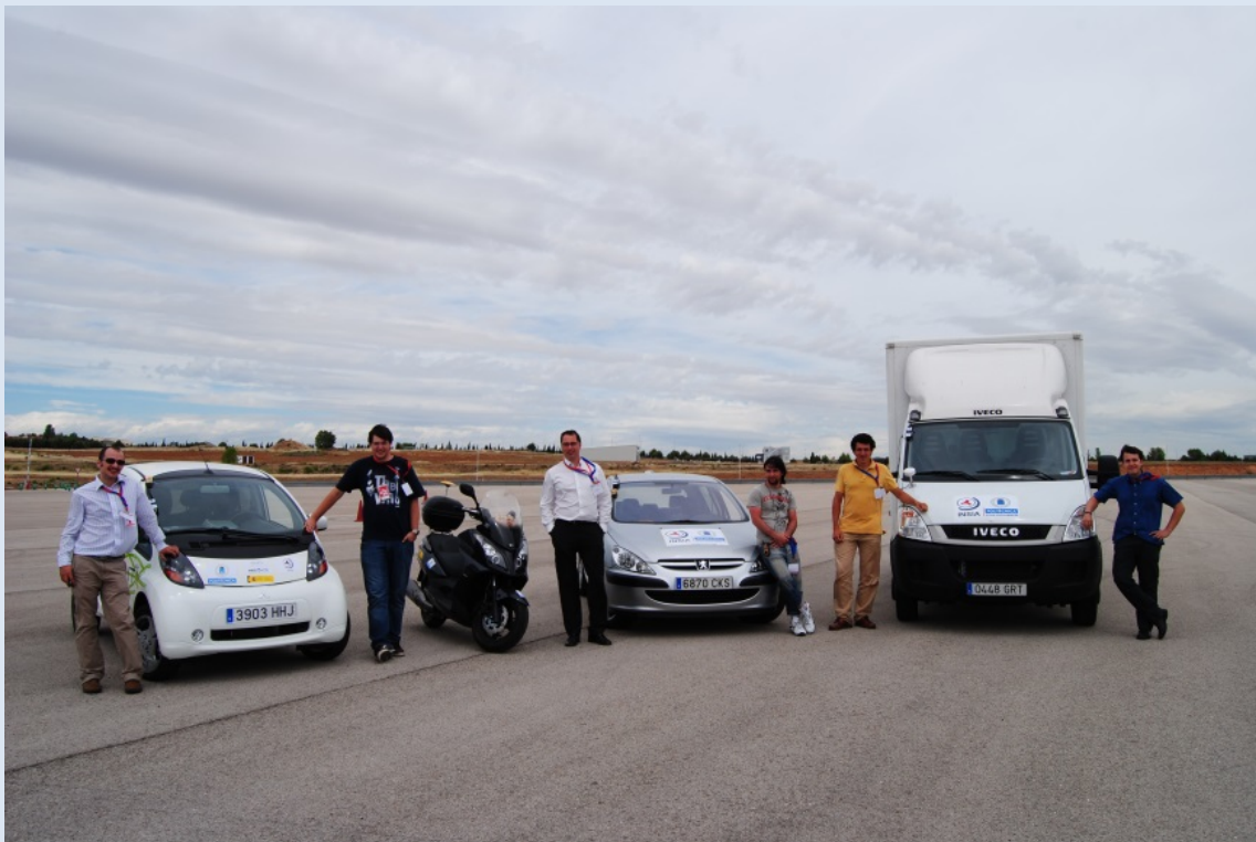
Figura 2. Imágenes de los vehículos y stands de los participantes de la UPM Endesa y Mitsubishi que participaron en las demostraciones del IEEE IV'12 en el INTA.