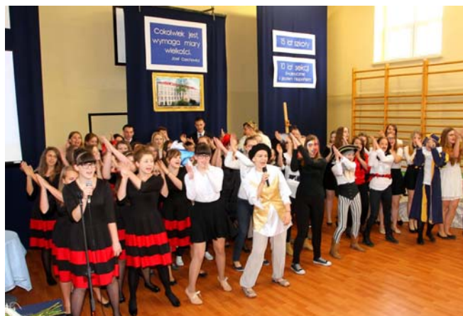
Acto de fin de curso en el Gimnazjum n° 19 de Lublin