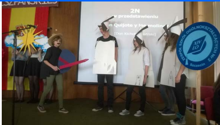
Visita a la Sección Bilingüe de Szczecin (Gimnazjum n° 32 y Liceo XIV)

Debemos añadir a estas visitas todas las realizadas para las entregas de premios a los mejores alumnos, que se han realizado a todas las Secciones Bilingües de español dependientes la Consejería de Educación. (Éstas aparecen indicadas en la página 6 de esta publicación). Además se han realizado visitas con motivo de las Olimpiadas de Español, festivales y concursos relacionados con el español en todo el país.