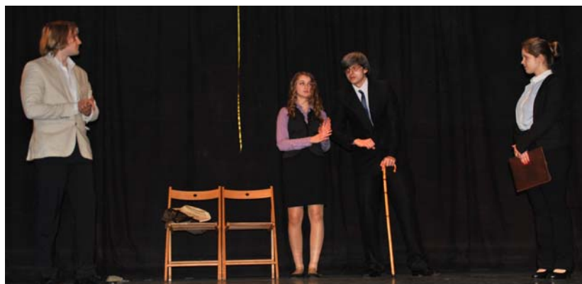
En la imagen inferior, el grupo de Łódź representa "Los árboles mueren de pie" de Alejandro Casona.