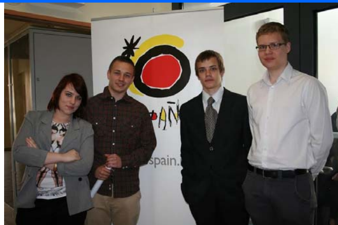
Finalistas de OJH pertenecientes a SSBB de español

Listado de finalistas y laureados en http://ojh.edu.pl/dokumenty/LISTA_LAUREATOW I FINALISTOW IV OJH 2013-14.pdf