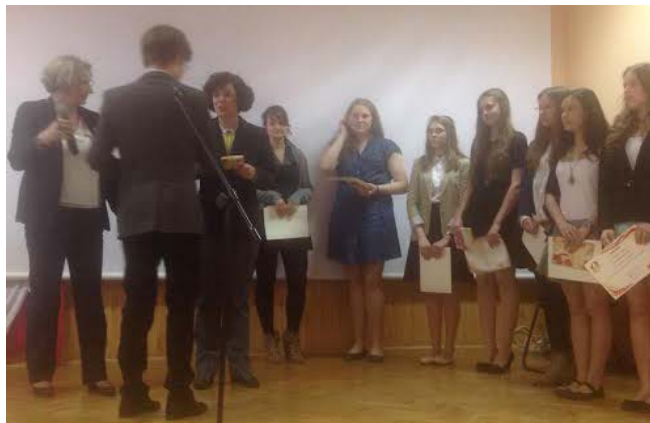
Entrega de diplomas en la Sección Bilingüe de Wrocław

Distintos representantes de la Consejería de Educación de España en Polonia han hecho entrega de los diplomas a los mejores alumnos de las 16 Secciones Bilingües de español dependientes de la Consejería de Educación de España en Polonia. Estos diplomas reconocen el gran esfuerzo realizado por estos alumnos y sirven para animar a sus compañeros a superarse.