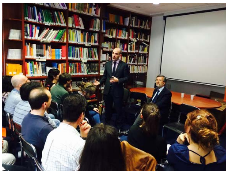
El Embajador de España en Polonia y el Consejero de Educación dirigen unas palabras a los profesoras y profesores españoles de las Secciones Bilingües en Polonia

El día 6 de junio de 2014, se reunió en la Consejería de Educación en Varsovia el profesorado de coordinación del profesorado de SSBB de Polonia.