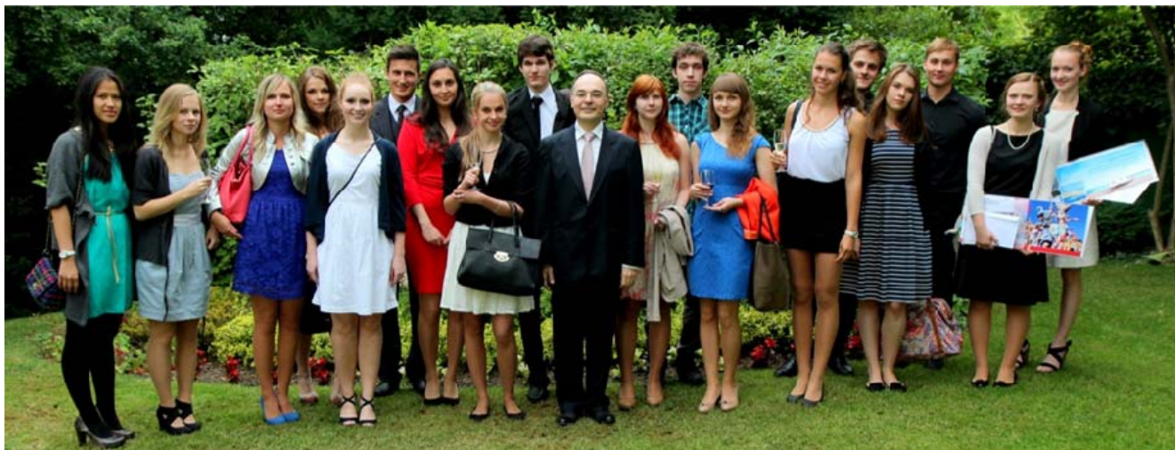
Alumnos destacados de las SSBB, presentes en la recepción del Embajador