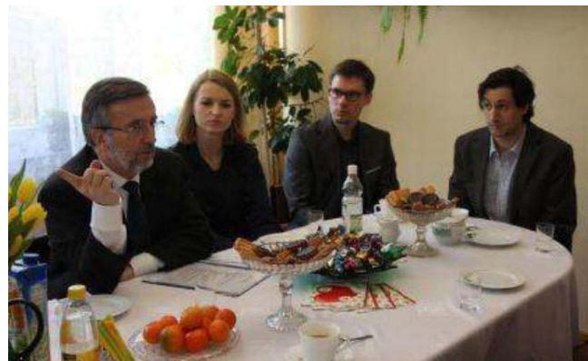
Dos imágenes del encuentro en el Liceo IX "Mikołaj Kopernik" de Lublin