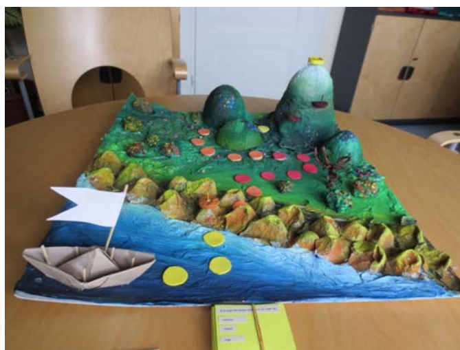
Trabajo ganador del concurso