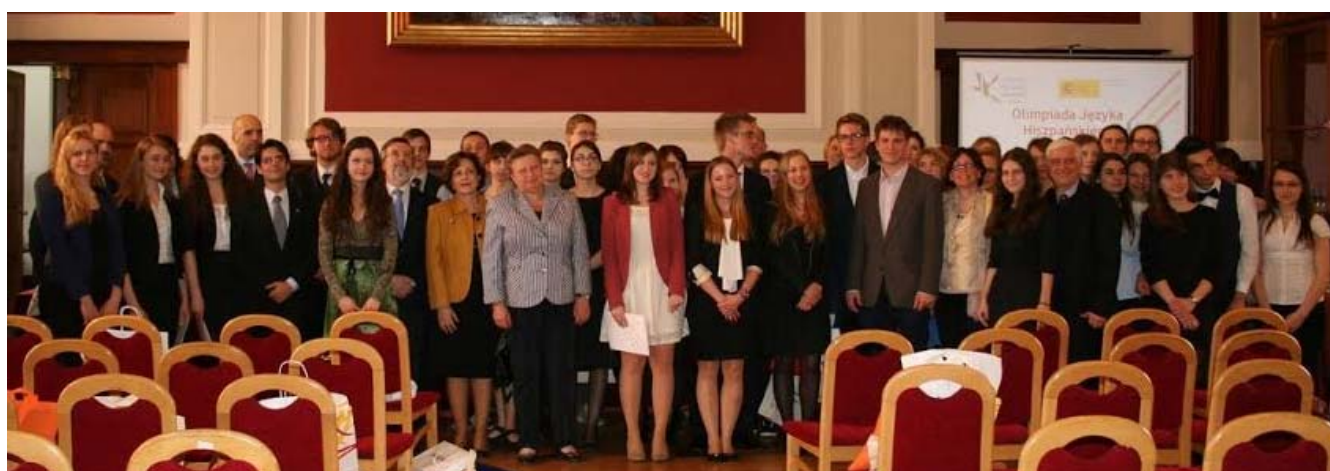
Imagen de los organizadores y patrocinadores de la Olimpiada de Español en Polonia y foto de familia de los finalistas 2014

El comité organizador de la Olimpiada de la Lengua Española en Polonia ha seleccionado en su cuarta edición a un total de 10 laureados y 31 finalistas.