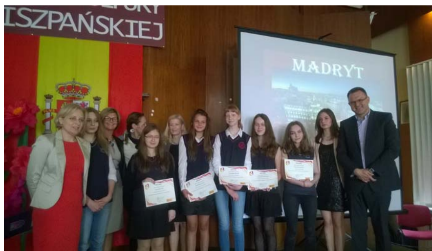
Los mejores alumnos de las Secciones Bilingües de Szczecin y de la SB del Gimnazjum n° 3 de Gdańsk muestran orgullosos sus diplomas

Deseamos felicitar a los premiados, además de señalar la gran dedicación de todos los alumnos y profesores para mejorar el conocimiento de la lengua, literatura y cultura españolas en las Secciones Bilingües de español.