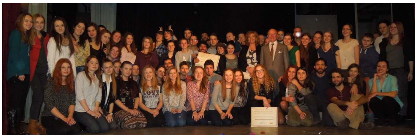
Los participantes en el festival de teatro posan junto al Embajador de España en Eslovaquia

Los días 11 y 12 de febrero de 2014 tuvo lugar en el teatro Dom Slovenského misijného hnutia de Banská Bystrica el V Festival de teatro en español de las Secciones Bilingües de Eslovaquia.