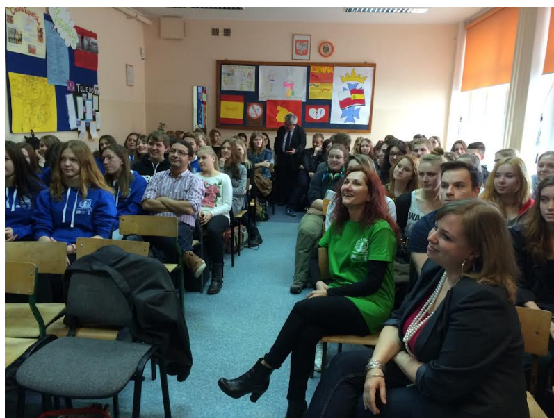
Al fondo de la imagen, el inspector de educación charla con los alumnos durante su visita a la Sección Bilingüe del Liceo XV de Gdańsk. Durante esta visita el alumnado ofreció información sobre el proyecto europeo en el participa este liceo.