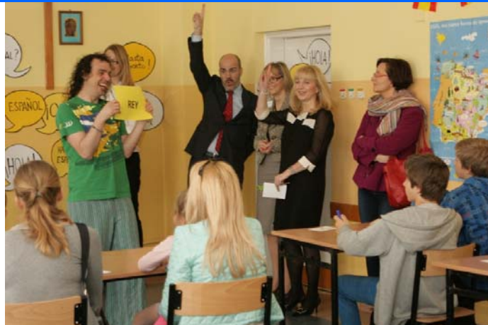
Día de puertas abiertas en el Gimnazjum n° 23 de Bydgoszcz

Entre los meses de febrero y junio de 2014, el equipo de la Consejería de Educación ha realizado numerosas visitas a las Secciones Bilingües de español, tanto a las que dependen directamente de la Consejería de Educación como a los centros de secundaria con Sección Bilingüe de español MEN.