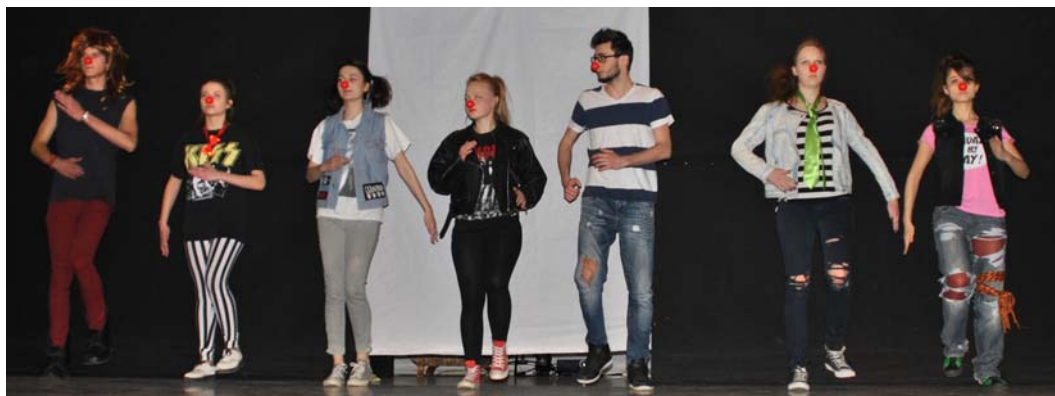
En la imagen superior, representación de "Noviembre" de Achero Mañas a cargo del grupo de Varsovia.

En este Festival internacional participó alumnado de Secciones Bilingües de español de 7 países de Europa Central y Oriental. El festival europeo de teatro escolar en español forma parte de los programas complementarios de las Secciones Bilingües de español que el Ministerio de Educación, Cultura y Deporte gestiona en los países de Europa Central y Oriental. Polonia estuvo representada por los grupos de teatro del XXXIV Liceo Miguel de Cervantes de Varsovia y del Liceo XXXII Halina Poświatowska de Łódź. Estos dos grupos habían ganado el IX Concurso de teatro escolar en español de Polonia. Más información sobre el último concurso en el número especial de Enlace dedicado al teatro http://www.mecd.gob.es/polonia/publicaciones-materiales/publicaciones.html .