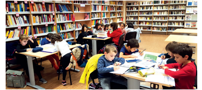
Alumnado del aula de París V trabajando en el Centro de Recursos