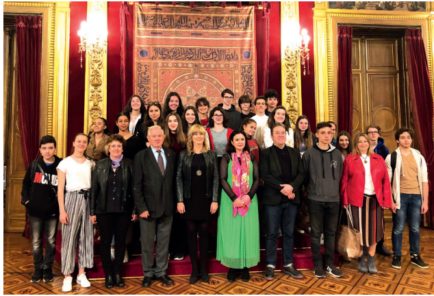
Viaje cultural a España (2019) de alumnos de la ALCE de París, que fueron recibidos en el Palacio de Navarra por la Consejera de Relaciones Ciudadanas e Institucionales del Gobierno de Navarra.