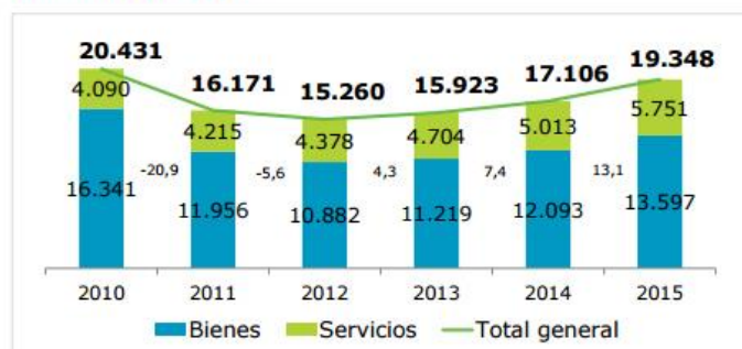
Ilustración 1. Importaciones de bienes y servicios TIC (millones de euros)

El comercio exterior de bienes y servicios del sector TICC continúa en la senda de crecimiento y presenta signos positivos en 2015. Las importaciones alcanzaron los 19.348 millones de euros y las exportaciones los 13.032, un 13,1 % y 7,1 % más que en 2014, respectivamente.