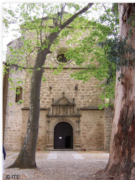
Monasterio de Yuste