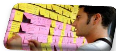
El hilo de la memoria (B1)