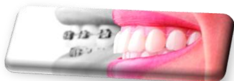
Una sonrisa de anuncio (A2)

Las secuencias publicadas hasta ahora son: