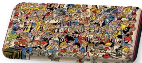
Viñetas y bocadillos (B2)