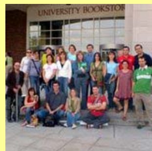
Grupo de profesores visitantes españoles en Estados Unidos, 2005

http://www.mec.es/exterior/usa/es/programas/visitantes/portada.shtml