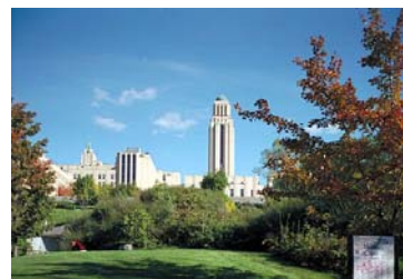
Imagen de la universidad de Montreal

En las siguientes páginas se presenta una amplia información sobre las actividades llevadas a cabo por estos centros de recursos a lo largo del presente curso académico, así como de las previstas para los próximos meses.