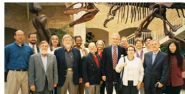
Grupo de participantes en una de las actividades organizadas por el Centro de Recursos en Kennesaw

Lectura del Quijote en la Universidad de Washington y conexión por videoconferencia con el Círculo de Bellas Artes de Madrid.