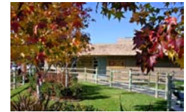
Los Alisos Middle School, ISA situada en Mission Viejo, California

Los estudiantes que se gradúan en estas escuelas y reúnen los requisitos mínimos reciben un certificado oficial y la posibilidad de homologar sus estudios con los estudios Españoles. Actualmente hay 38 ISAs entre Estados Unidos (28) y Canadá (10).