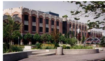
Imagen de la universidad de York, en la que se encuentra el Centro Español de Recursos en Toronto.

Los Centros Españoles de Recursos en Canadá se encuentran situados en la universidad de York (en Toronto) y en la universidad de Montreal.