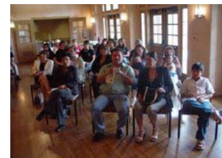
Momento de la ceremonia de entrega de premios del concurso literario en Albuquerque, Nuevo Méjico, el 23 de abril de 2007