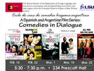
Cartel anunciador de la serie de cine en Español en Baton Rouge

Jornadas de presentación de los recursos del CER y de los programas de la Consejería a profesores y estudiantes.