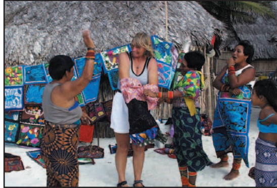
Ilus. 14: turista

La construcción de hoteles se llevó a cabo en varias islas para que los turistas pudieran visitar el área. El control sobre las instalaciones turísticas fue siempre una inquietud y un conflicto para los kuna. Existe una ley desde el año 1982 que les prohíbe a personas ajenas actividades comerciales y la adquisición de tierra dentro del territorio kuna. Hubo algunas personas que ignoraron esta ley y que construyeron hoteles de todos modos. Esto provocó que algunos kuna quemaran los hoteles y forzaran a los extranjeros a irse. En los años 70, el Instituto Panameño de Turismo (IPAT) elaboró un proyecto de transformación de la región Carti en un centro turístico internacional. El Congreso General se opuso a este proyecto y finalmente logró que fuera abandonado. En el año 1996 los kuna aprobaron un estatuto para controlar el turismo. Este estatuto también controla los aspectos económicos, ecológicos y sociales del turismo. Desde ese momento, se les sigue prohibiendo a inversores extranjeros lanzar proyectos turísticos y las ofertas para los turistas deben ser aceptables desde un punto de vista ecológico y conciliables con el concepto del mundo de los kuna.