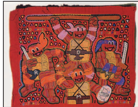
Ilus. 13: mola con los “turtles”

Al principio las molas sólo fueron vendidas a los turistas pero luego, después de la invasión de los Estados Unidos en el año 1989, surgió un sentimiento nacionalista en Panamá y también los panameños empezaron a interesarse por las molas y las compraron para sus propias casas.