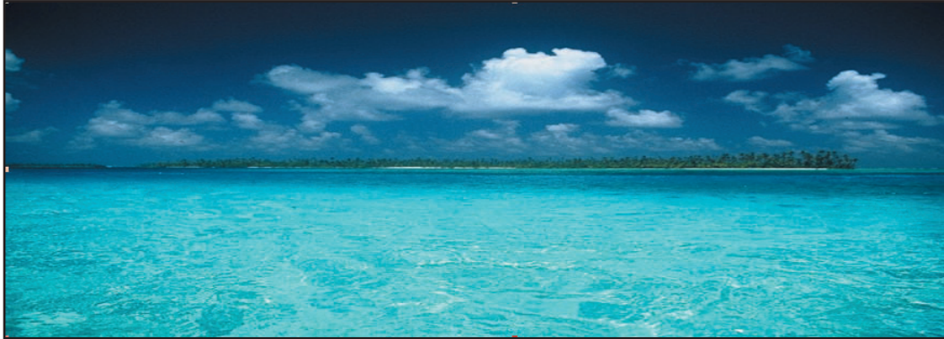
Ilus. 1: isla en la Comarca de San Blas

A principios del año 2003 regresé de mi año de intercambio en Panamá. En este año un par de estudiantes de intercambio fuimos a pasar algunos días en las islas de San Blas, donde me encontré con los kuna. Nosotros los europeos siempre nos imaginamos las islas de ensueño con palmas y playas de arena blanca y las islas de San Blas se ven exactamente así. Pero no sólo me encantaron las islas de fantasía sino que también los kuna, su forma de vestir y mantener las tradiciones y la unidad con la naturaleza, me gustaron mucho. Los kuna me impresionaron tanto que decidí ya entonces dedicar mi trabajo de maturidad a este pueblo peculiar y tan interesante. Cuando yo estaba ahí, no sabía mucho de esta gente. Conocía algunos datos pero quería investigar más y he encontrado una historia, en mi opinión, fascinante.