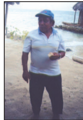
Ilus. 10: hombre kuna