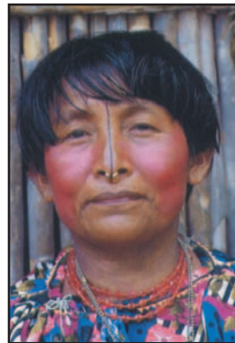
Ilus. 9: mujer kuna