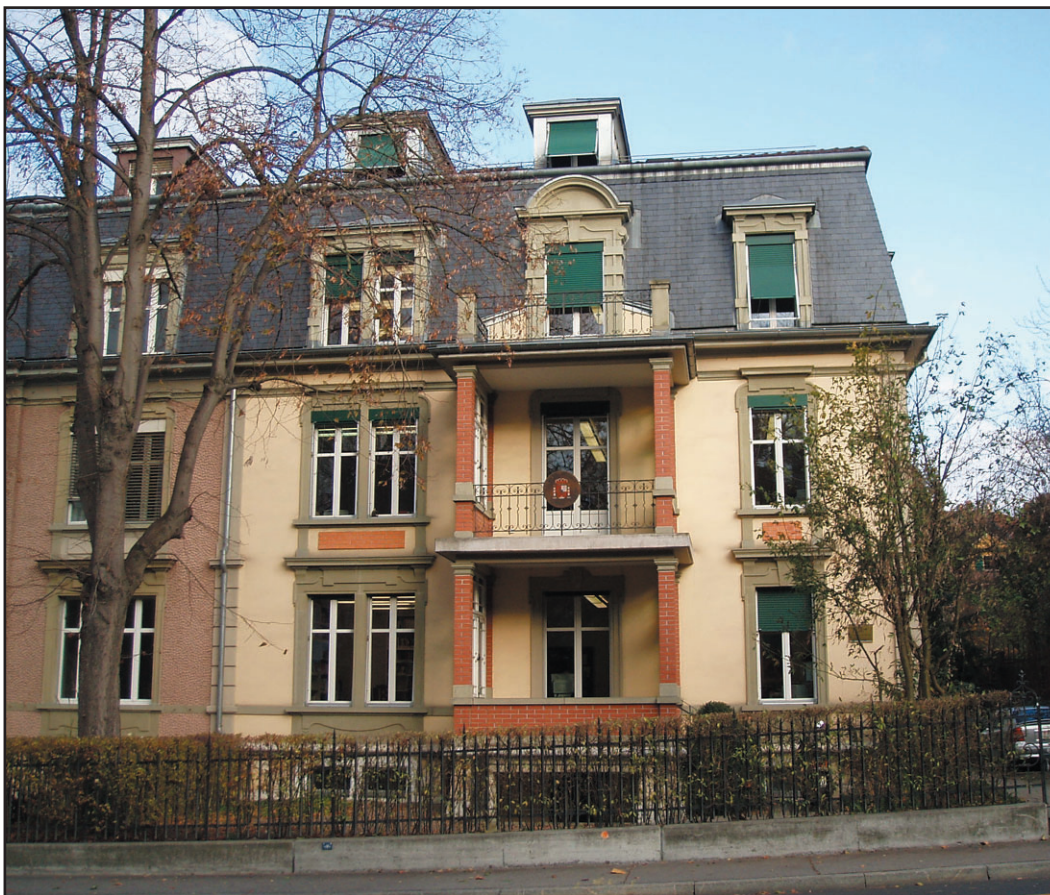
Consejería de Educación de la Embajada de España en Berna.