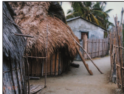
Ilus. 7: casa kuna