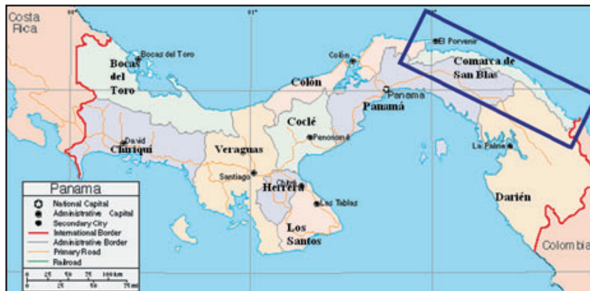
Ilus. 3: mapa de Panamá