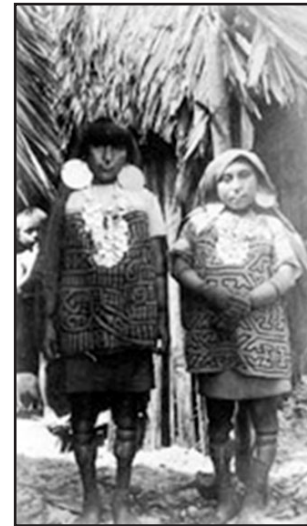
Ilus. 11: kunas

Después del descubrimiento de Panamá por Rodrigo Galván de Bastidas en 1501, varios europeos llegaron al Istmo. Entre ellos también Cristóbal Colón. Pero muchos desistieron por ataques de los indígenas, enjambres de mosquitos, el clima húmedo y cálido, la densa vegetación tropical y la montaña inhospitalaria. Entre los indígenas que luchaban contra los conquistadores también se encontraron las poblaciones kunas. Ellos amenazaron durante el siglo XVII las expectativas españolas de colonizar la región. Entre 1719 y 1726 los kunas del Darién lucharon contra la dominación de los españoles. Colaboraron con los piratas y también se opusieron masivamente contra los intentos de convertirlos en cristianos. Ante tal amenaza, la Corona española expidió una Real Orden para la “reducción” o “extinción” de los kunas. Los españoles emplearon a los indios chochoes de Colombia para formar un “ejército de choque”. Unidos con los negros y españoles, lograron echar a los kunas hasta las cabeceras de los ríos Chucunaque y Tuira. Más tarde los españoles firmaron un acuerdo con los indios kuna por el que se les prometía a éstos el término de los ataques españoles, procurando este acuerdo un socio comercial a los españoles.