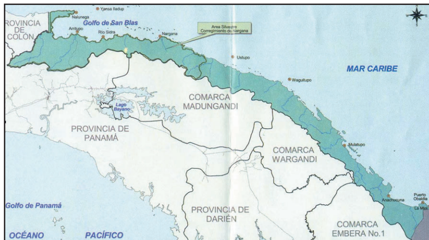
Ilus. 4: mapa de la Comarca de San Blas