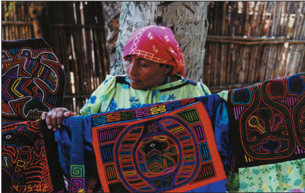
Ilus. 2: mujer kuna con molas

continuamente, como veremos, surge la cuestión de la pérdida de identidad. Pero también la situación actual debe ser mencionada puesto que es el resultado de los acontecimientos de la historia. Por último pienso dedicarme al tema de la comercialización de la mola y el turismo, o sea, a una “forma de participación en la globalización”. Espero poder descubrir durante mi trabajo elementos y momentos que pusieron y ponen a los kuna en contacto con la “civilización” haciéndoles perder o mantener su propia identidad.