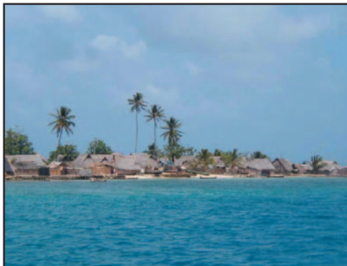
Ilus. 6: pueblo kuna

Los kunas tienen una religión monoteísta con un aspecto espiritual que es muy íntimo y por eso es muy custodiado. Ellos creen en un dios que creó todo lo que existe: tierra, plantas, animales... Están convencidos de que sólo verán a este dios el día de su muerte y que él ha mandado a sus ángeles a la tierra para que cuiden de ellos. Ellos creen que la tierra tiene forma de vasija de barro o, como ellos dicen, totuma, y que lejos, en las estrellas, está el cielo al que llegarán cuando mueran y en el cual vivirán eternamente en paz e igualdad. Los kunas también están convencidos de que, después de haber creado la tierra, su dios mandó una serie de "héroes" al mundo para que guiaran a los kunas y les enseñaran las costumbres que debían seguir. Es así como los kunas obtuvieron su conocimiento sobre las formas de cantar, vestirse, fabricar molas, desarrollar artes, etc. Los kunas tienen un árbol de la vida y también leyendas y cuentos sobre sus antepasados.