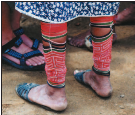
Ilus. 8: winis

Los kuna son famosos por sus coloridas artesanías, que son utilizadas para el uso personal y comercial. El producto más conocido en todo el mundo es la mola. La leyenda cuenta que Kikkatiriyai, la hermana del profeta Ipeorkun, vino del cielo para enseñarles a las mujeres kuna la habilidad de confeccionar la mola 5 . Se cose con la técnica del aplique invertido sobre telas superpuestas de diferentes colores y luego se adhiere a la parte frontal de la blusa. Hasta el año 1800 no existen fuentes escritas sobre el vestido mola. De 1800 a 1900 las mujeres empezaron a utilizar vestidos con colores más radiantes ya que llegaron a tener acceso a estos por comerciantes. La decoración de las blusas de mola se incrementó permanentemente hasta que en los años 20 las mujeres kuna cubrían todo excepto el cuello y las mangas de las blusas con molas. En los años 20 las molas fueron descritas como camisas que llegaban casi hasta las rodillas. Hoy en día la producción de molas es una fuente económica muy importante para los hogares.