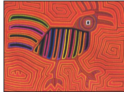
Ilus. 5: mola

Las casas son bohíos de paja y de caña brava contruidos sobre el suelo arenoso. No consisten en general en más de dos habitaciones, las cuales son usadas como habitaciones para dormir y para los quehaceres domésticos. La casa está poco amueblada. Camas, por ejemplo, no existen ya que los kunas duermen en hamacas. Luego existen casas construidas por la comunidad para la realización de ceremonias y fiestas.