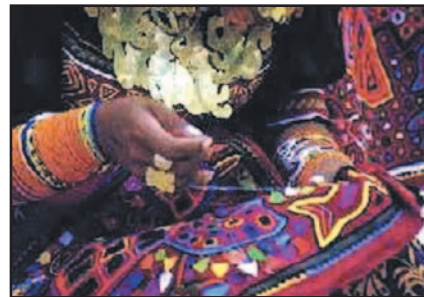
Ilus. 12: mujer kuna cosiendo mola

A principios del siglo XX, con la llegada de los estadounidenses por la construcción del Canal de Panamá, se inició la comercialización de la mola de un modo todavía muy modesto. Los extranjeros se interesaron por esos trozos de tela que llevaban puestas las mujeres kuna. Ellas se asombraron de que los americanos les compraran sus blusas usadas. Por entonces los hombres kuna empezaron a ir a las ciudades grandes para trabajar. Esto, más la disminución posterior de las actividades en la agricultura y la pesca de subsistencia, tuvo un impacto enorme en los hogares de San Blas. Intermediarios que empezaron a comprar las molas para luego venderlas en las zonas turísticas explotaron a las mujeres kuna. Ellas, desesperadas por venderlas pero no dispuestas a aceptar los bajos precios, buscaron activamente mercados alternativos. Pronto existieron diferentes posibilidades para comerciar las molas: dentro de una cooperativa, como productor individual o como parte de trabajo a destajo. Había diferentes aspectos en todas estas posibilidades: los productores individuales cosían la mayoría de sus molas para la venta pero no tenían un mercado garantizado para sus productos. El trabajo a destajo, en cambio, era considerado por las mujeres kuna como aburrido ya que no podían escoger libremente los colores y los diseños y además perdían la visión general sobre sus productos.