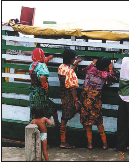
Ilus. 15: mujeres kuna

chos y su identidad. Al hacer el trabajo me fascinó más y más ese pueblo que, al comienzo, para mí sólo era interesante porque yo misma había compartido algunos días con ellos.