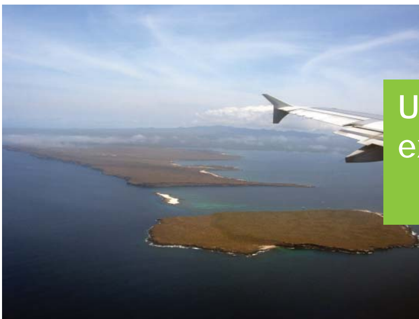
Vista aérea de las Islas Galápagos.

AUTORA: Isabel Rubio Pérez Asesora técnica de la Consejería de Educación