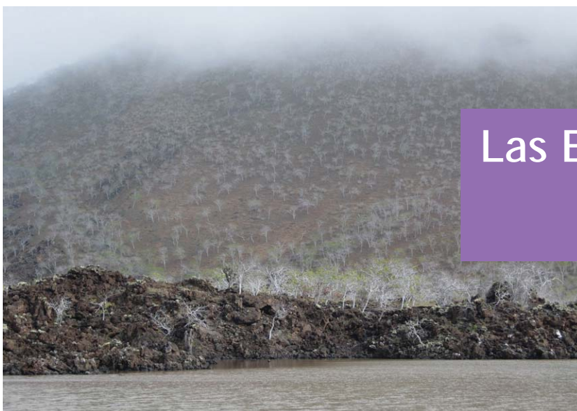
La isla Santa Fe.

AUTORA: Isabel Rubio Pérez Asesora técnica de la Consejería de Educación