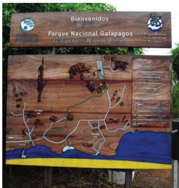
Parque Nacional Galápagos

Esta fundación es una organización internacional de investigación sin ánimo de lucro que tiene como misión la conservación de la fauna y la flora de las Islas Galápagos.