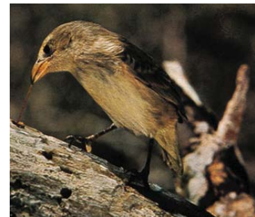
Los pinzones que Darwin encontró en las Galápagos desempeñaron un papel importante en el desarrollo de su teoría sobre la evolución de las especies.