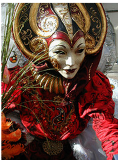
Carnaval de Venecia

El Carnaval es una de las fiestas más populares de la tradición hispana. Su origen histórico se encuentra probablemente en las fiestas paganas que se realizaban en honor de distintas divinidades como Dioniso, dios del vino, en la Grecia clásica, o Saturno, dios de la agricultura y las cosechas, en la mitología romana. Quizá sus raíces se remontan aún más atrás y su origen esté en Egipto, en las fiestas en honor del buey Apis, hace miles de años. El Imperio Romano difundió la costumbre por Europa y ésta fue llevada a América en el siglo XV por los navegantes españoles y portugueses.