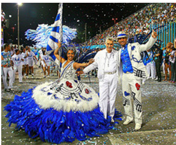
Carnaval de Río de Janeiro