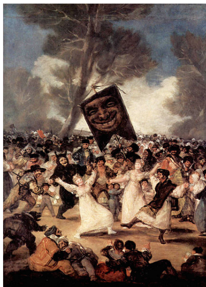
Entierro de la sardina. Francisco de Goya. Óleo sobre tabla. 82,5 x 62 cm.

El Carnaval de Cádiz es también famoso. Seguramente por la influencia de los mercaderes genoveses en el siglo XV, toma aspectos del carnaval italiano, como los antifaces, las caretas, las serpentinas y el confeti. Sobresalen, por su gracia e ingenio, los concursos de chirigotas: coros que cantan coplas humorísticas acompañados de instrumentos musicales de fabricación casera, tales como sartenes, cajas, botellas y pitos.