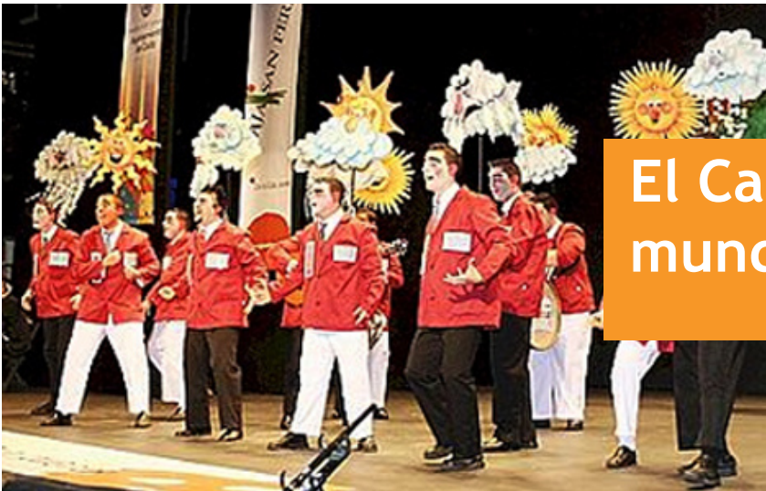
Carnaval de Cádiz. Concurso de chirigotas

AUTORA: M a Belén Roza González Asesora técnica de la Consejería de Educación en el Reino Unido