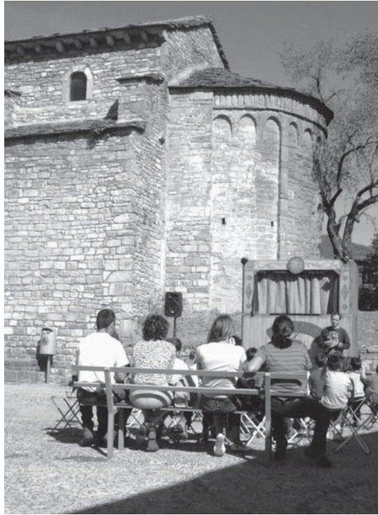
Actividades de animación a la lectura: representación de títeres

38 horas a la semana la Sala de Adultos y 27,5 horas la sala Infantil/Videoteca.