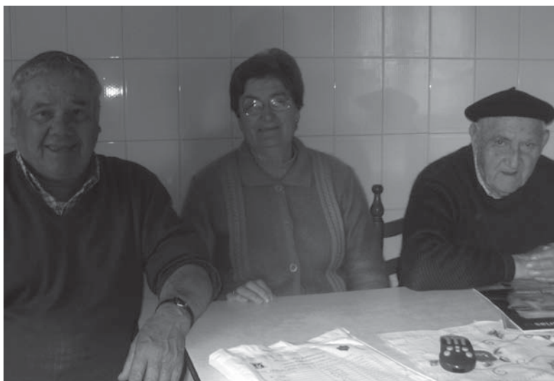
Usuarios del programa de préstamo a domicilio para SAD

La biblioteca, en coordinación con el centro de Servicios Sociales, facilita a las personas que lo soliciten material disponible del servicio de préstamo. Las personas interesadas formulan verbalmente la petición a su auxiliar de ayuda a domicilio y ésta lo traslada a los Servicios Sociales. Automáticamente se pone en marcha el circuito: se cursa el carnet de usuario, se cumplimenta el sobre de préstamo, se selecciona el material solicitado y se traslada al centro de Servicios Sociales, donde la auxiliar de Ayuda a Domicilio se encarga de entregarlo en un plazo máximo de tres días. Las condiciones de préstamo son las mismas que para cualquier otro usuario de la biblioteca.