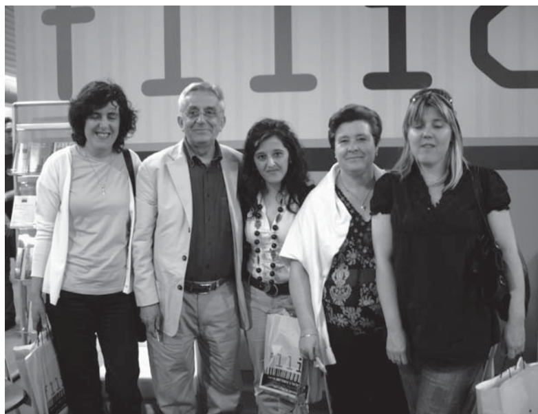
Visitamos la Feria Regional del Libro en Cuenca

Una vez cumplido el primer objetivo, el segundo objetivo estuvo claro: poner en marcha un verdadero plan de fomento a la lectura a todos los niveles, además de un programa de extensión cultural.