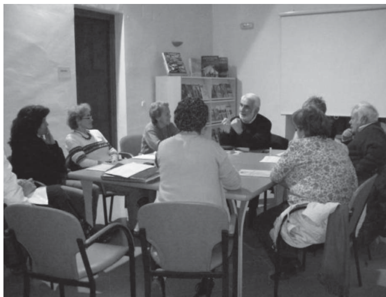
Con los mayores: Club de lectura