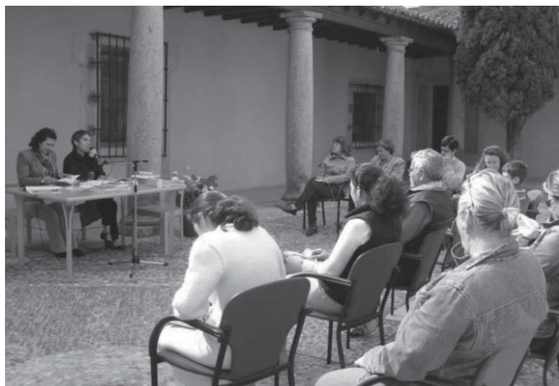
Celebrando el Día del Libro en el patio porticado

Durante el año 2008 logramos una segunda ampliación, anejándonos 93 m 2 . El motivo fue doble: la necesidad de disponer la colección local y la carencia de un espacio polivalente en el que desarrollar actividades como conferencias, cuentacuentos familiares,