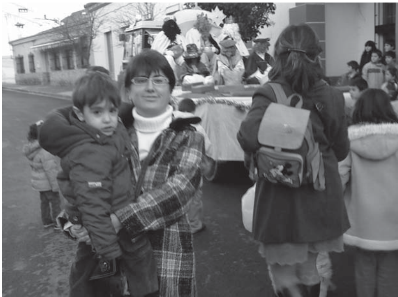
Los Reyes Magos en Alatoz

En Alatoz estamos intentando optimizar el aprovechamiento del poco hardware del que disponemos para canalizar los recursos educativos y culturales con los que contamos. Lo que sí tengo claro es que la argumentación utilizada por el presidente de la Royal Society inglesa (año 1803) es la antítesis de lo que necesita la sociedad moderna, que no es otra cosa que cada vez haya más y mejor formación y más facilidad de acceso a la cultura para todos. Pues la educación favorece directamente el desarrollo social y económico, es motor para el crecimiento de las capacidades personales y por tanto la educación es el instrumento que proporciona a los ciudadanos una formación plena que les ayuda a estructurar su identidad y a desarrollar sus capacidades para participar en la construcción de