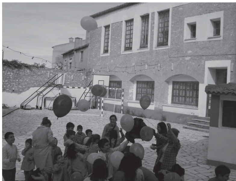
Celebración del Día de la Biblioteca en el colegio

La biblioteca municipal, como agente dinamizador del pueblo, ha ido acomodándose a las peculiaridades e idiosincrasia del mismo, aceptando e incorporando la diversidad. Esto se refleja también en la biblioteca. Sobre todo los niños y las niñas inmigrantes que a