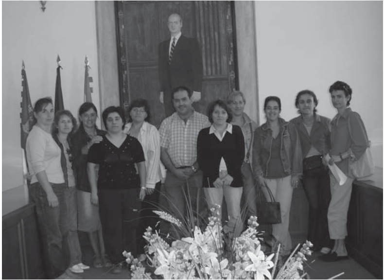
Entrega del cheque escolar a las madres de los alumnos del C. P. Antonio Requena de Alatoz