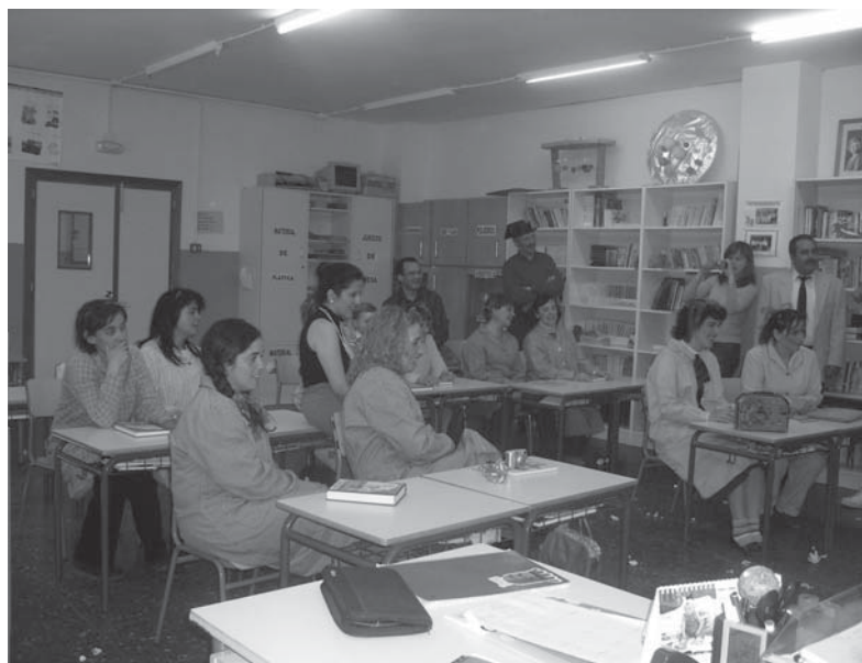
Padres y madres de alumnos representando una obra de teatro en el aula del colegio

Como ya hemos venido diciendo la biblioteca es el único servicio público del pueblo que está abierto por la tarde, atendiendo a las necesidades informativas de los usuarios. Ofrecemos información que puede ir desde horarios de farmacia a horarios de autobús, ofertas de empleo público, verano joven, etc. Se ha convertido en un gran centro de información para la comunidad y fomenta la participación de las personas en la sociedad y en la vida del pueblo. La biblioteca atiende necesidades informativas de toda índole, y no