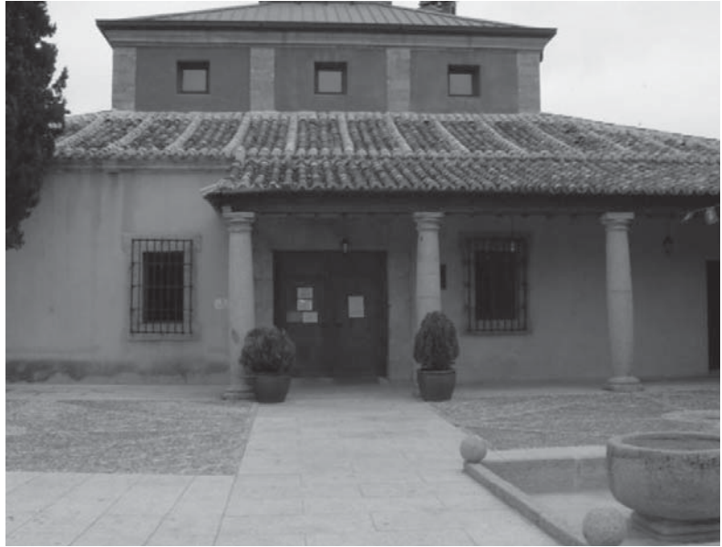
Exterior de la biblioteca. Palacio de la Sagra

de su horario. Por ello, desde el año 2008, forma parte de la mesa de expertos que la Concejalía de Cultura ha creado para desarrollar políticas sociales y culturales, mesa formada por tres políticos, dos vecinos cualificados de la localidad y la bibliotecaria. Ella ha sabido transmitirnos a todos, políticos y vecinos, entusiasmo por la cultura y preocupación por el bien común. Desde el año 2007 la biblioteca cuenta, además, con una auxiliar de biblioteca para que ayude y apoye los proyectos y servicios bibliotecarios, y durante este año 2009 hemos puesto a su disposición una persona contratada eventualmente como animador sociocultural. Por todo ello, está demás decir que animamos a otros municipios, con nuestras características o no, a no descuidar a sus bibliotecarios, puesto que ellos son la imagen humana de nuestras bibliotecas y realizan, con una profesionalidad vocacional, tareas que sobrepasan sus funciones, siendo, por lo general, muchas veces insuficientemente pagados. Quizá sea el momento de reflexionar y buscar soluciones a esto último. Quizá las diferentes administraciones deberíamos unirnos de alguna manera y, cuando se establezcan las nuevas bases para un futuro convenio, seguir el modelo establecido por las escuelas infantiles, donde la administración regional y local compartimos obligaciones. Porque ellos, técnicos de indudable cualificación, son sin duda la parte viva y activa de cualquier sistema bibliotecario.