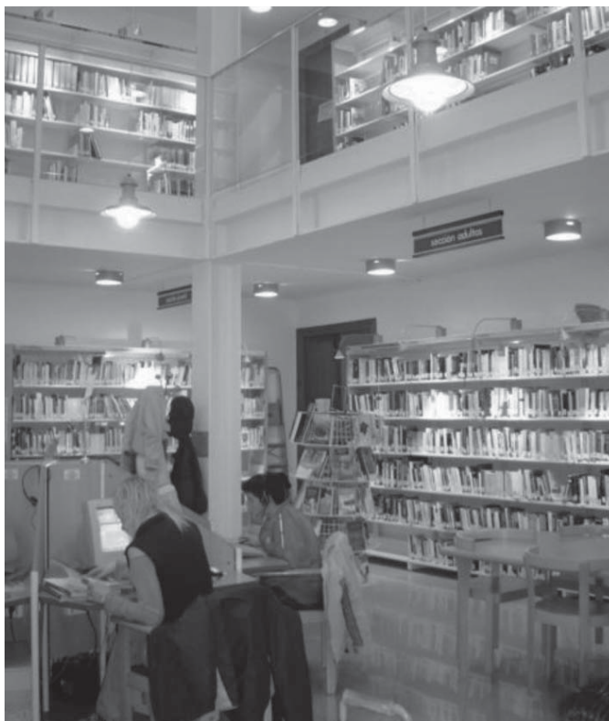
Interior: Sección Internet y Narrativa

Acudimos a este Encuentro para compartir con todos vosotros nuestra experiencia bibliotecaria. No sabemos si lo que vamos a comunicar puede ser de alguna utilidad al panorama bibliotecario español pero, desde nuestro modesto rincón, queremos haceros llegar el trabajo realizado hasta ahora, así como el empeño y la