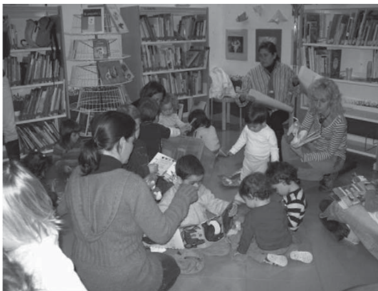
Con los pequeños: Formación de usuarios