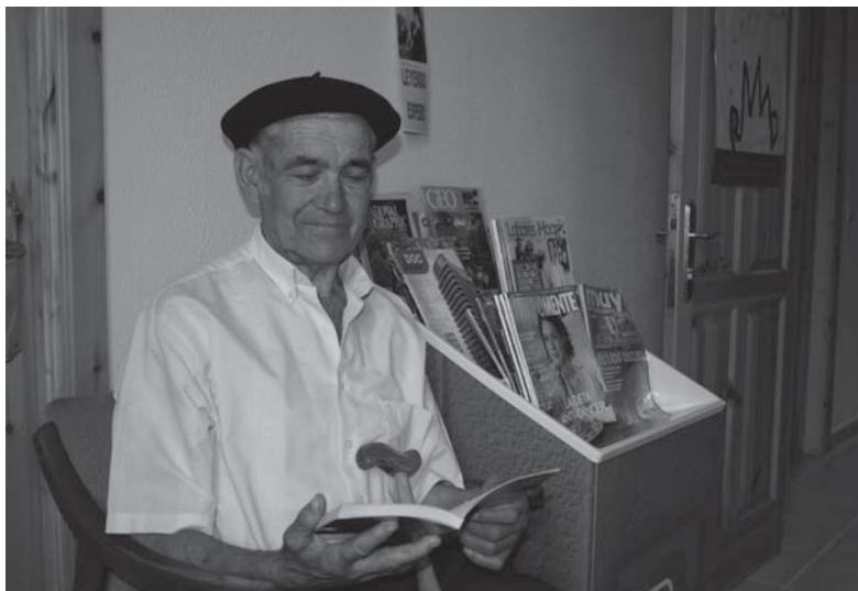
Usuario del programa «Leyendo Espero»

folletos y material bibliográfico, con especial atención a aquellos materiales que traten de la zona o se publiquen en la comarca y alrededores y por personas o entidades afincadas en la región. Materiales que están a disposición de todos los «usuarios» de la consulta médica y de los vecinos de Presno en general, de manera regular y gratuita. El consultorio comparte espacio con otros servicios municipales, entre ellos la biblioteca circulante, de manera que los vecinos que quieran llevarse en préstamo alguno de los materiales que la biblioteca central de Castropol deposita periódicamente en la sede circulante puede hacerlo siguiendo las pautas de préstamo establecidas.