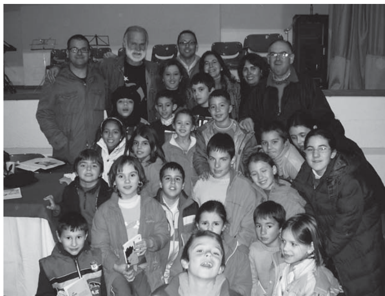
Encuentro con el escritor Gonzalo Moure

El éxito y acogida de las actividades entre los niños nos impulsó en su momento a desarrollar actividades en las que tuviesen que intervenir también los padres y madres de alumnos. Me refiero en concreto a la Asociación de Padres y Madres. Todos los años,