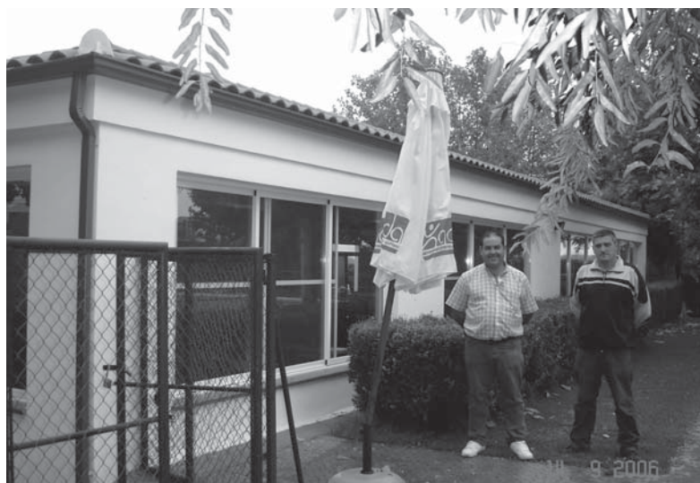
Integración del nuevo restaurante de la piscina municipal, en el solarium anejo

A mi juicio, la creación y participación en asociaciones es el motor fundamental de la vida cultural y educativa en los pequeños pueblos. Y es en el papel de guías, incluso impulsores para la creación de la estructura social de grupos, clubes y asociaciones, así como iniciativas empresariales y profesionales, donde los responsables políticos debemos ser más cautos y desinteresados, ponernos como objetivo prioritario el «desarrollo» de nuestros pueblos utilizando como única herramienta el respeto al medio ambiente y el bienestar de las personas. Y dejando de lado las tentaciones