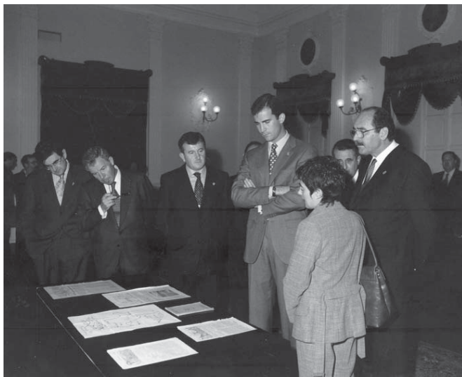
El Príncipe de Asturias visita la biblioteca en 1997