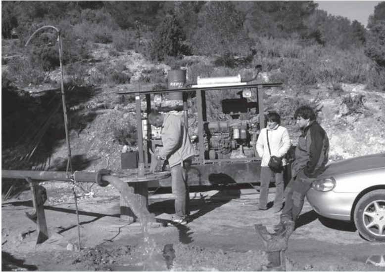
Captación de agua que nos ha permitido dejar atrás treinta años de escasez de agua potable. Plan de Obras Hidráulicas de Emergencia del Ministerio de Medio Ambiente, Junta de Castilla-La Mancha y la Diputación de Albacete