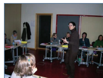
Formación en Luxemburgo