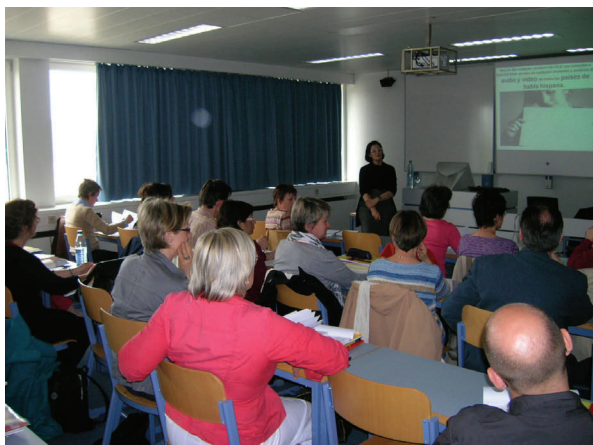
IX Jornada Pedagógica en Bruselas

El programa completo de la Jornada que incluye los resúmenes de los talleres y otros detalles de carácter práctico puede descargarse desde este enlace . La inscripción es gratuita y está abierta a todos los profesores de español. El plazo está abierto desde el 1 de marzo hasta el 15 de abril o hasta que se agoten las plazas disponibles. Para inscribirse hay que descargar el formulario de inscripción desde este enlace y enviarlo a asesoriabelgica.be@educacion.es .