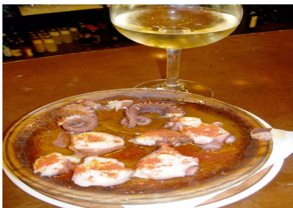
Pulpo a la gallega y copa de vino blanco.