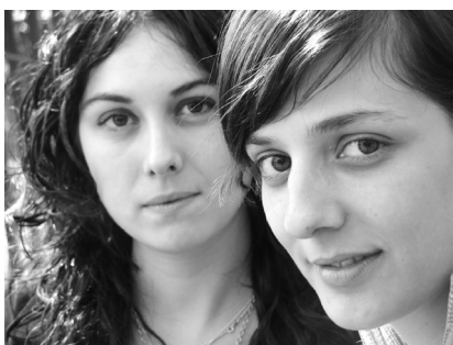
Jóvenes posando.

AUTOR: José Joaquín Moreno Artesero Asesor técnico de la Consejería de Educación en Reino Unido e Irlanda