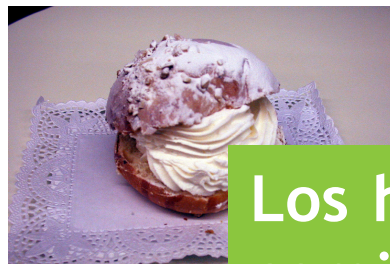
Bollo de nata