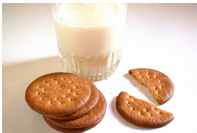
Leche con galletas