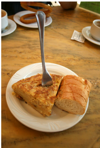
Pincho de tortilla