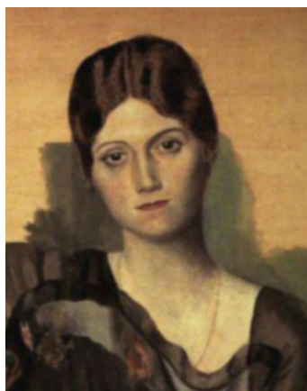
Pablo Ruiz Picasso. Retrato de Olga en un sillón . 1917 (fragmento)