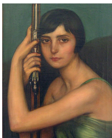
Julio Romero de Torres. La escopeta de caza . 1929. (fragmento)