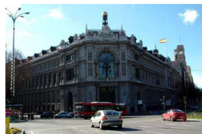
Fachada del Banco de España, en Madrid.

Todo ello debe influir en la creación de una imagen exterior más adecuada a la realidad de España: un país moderno y dinámico en que el peso de la agricultura es anecdótico —supone menos del 5% del producto interior bruto— y en el que cada vez más empresas se han adaptado a la realidad global de la economía y compiten codo con codo con las grandes multinacionales del mundo.