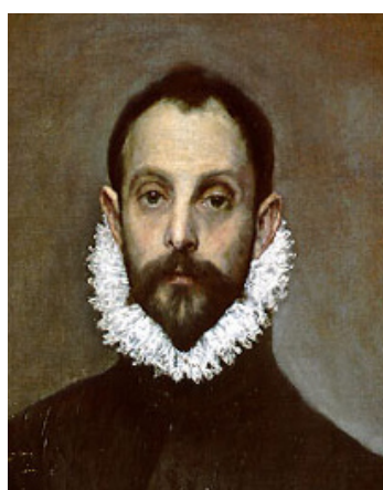
El Greco. El caballero de la mano en el pecho . Circa 1578 (fragmento).