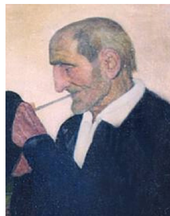
Ramón de Zubiaurre. Personaje con pipa (fragmento)