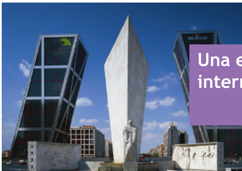
Plaza de Castilla. Madrid.

AUTOR: Manuel Balaguer Carmona Asesor técnico de la Consejería de Educación en el Reino Unido e Irlanda