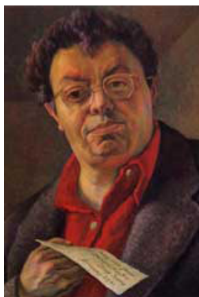
Diego Rivera. Autorretrato . 1941