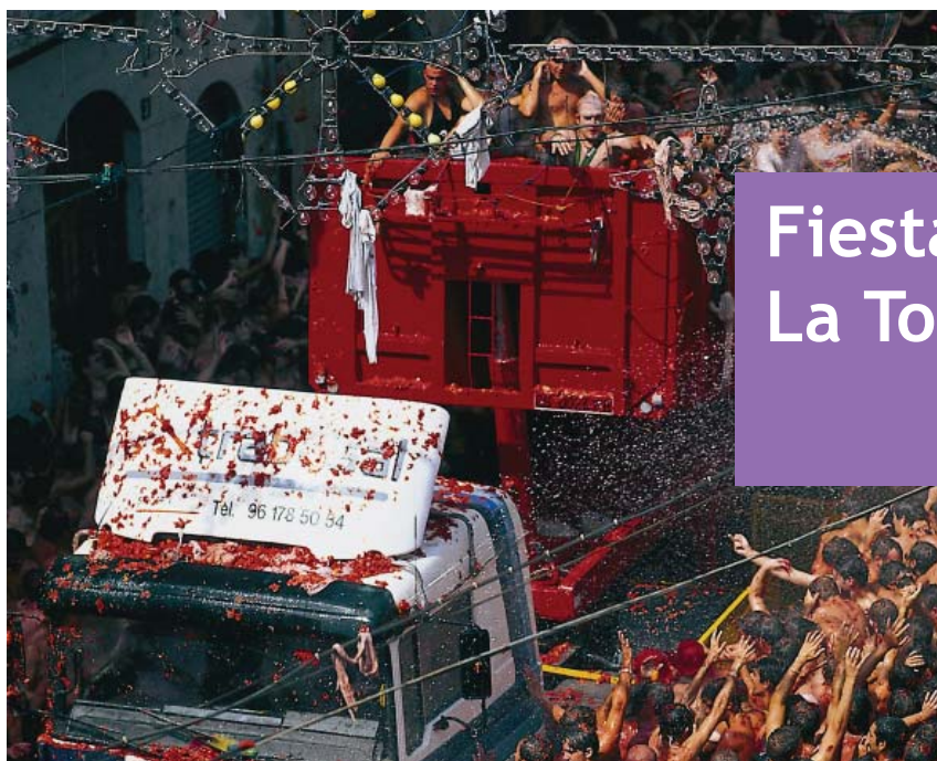
La Tomatina.

AUTOR: Javier Pablos Pachón Asesor técnico de la Consejería de Educación en el Reino Unido e Irlanda