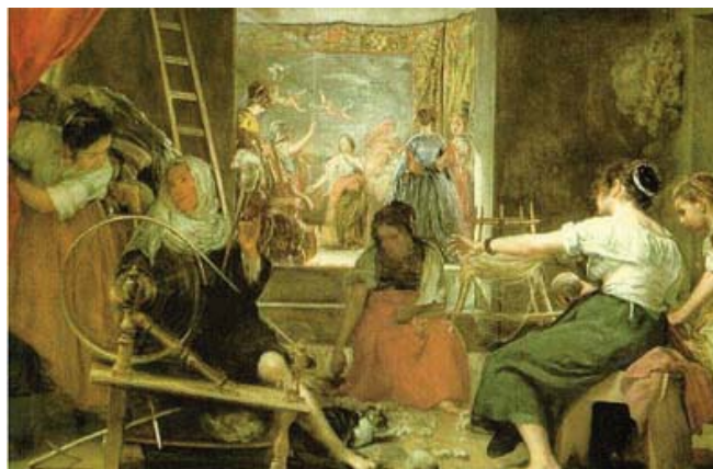
c) Las hilanderas. Tercera etapa en Madrid.