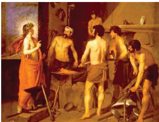
b) La fragua de Vulcano. Primer viaje a Italia.