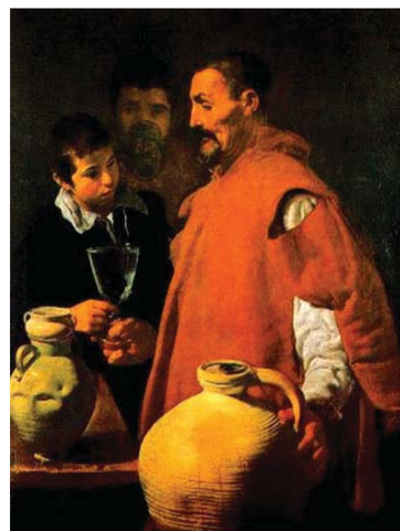
El aguador de Sevilla.