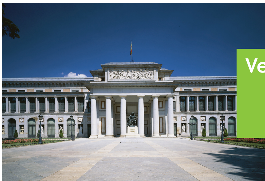
Museo del Prado. Madrid.

AUTORA: Carmen Arnaiz Abad Senior lecturer in Spanish and Linguistics. University of West of England