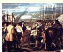
La Rendición de Breda