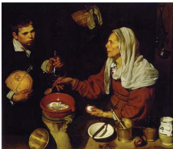
Vieja friendo huevos.