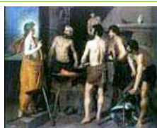
La fragua de Vulcano