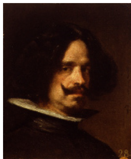
Autorretrato h. 1650

En la obra de Velázquez hay diferentes etapas que reflejan las experiencias adquiridas en sus viajes a Italia y en las ciudades en las que vivió: Sevilla y Madrid. El momento más importante de su carrera es su nombramiento como Pintor del Rey Felipe IV en 1623. Es en esta época cuando empieza a ser más conocido en la Corte española.