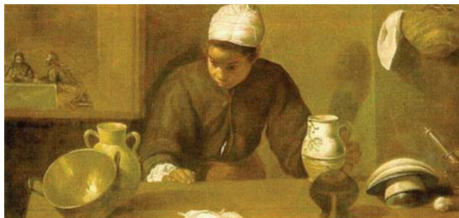
a) La mulata. Etapa sevillana