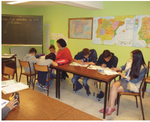
En clase trabajamos.