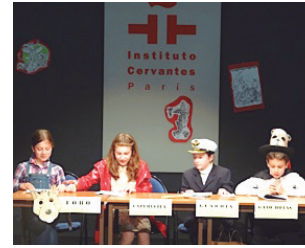
Nos gusta hacer teatro.