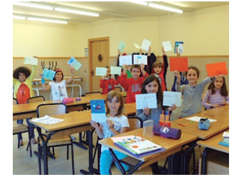
Y nos encanta participar.