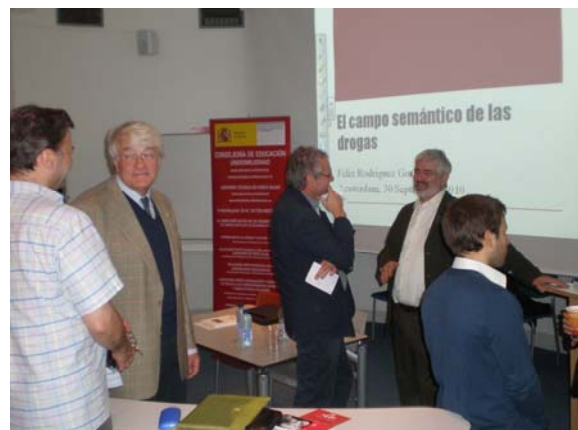
Un momento en la sala después de la conferencia con el conferenciante y varios profesores de la UVA.

Es autor asimismo de numerosos artículos sobre siglas y anglicismos en revistas nacionales e internacionales. Actualmente está desarrollando varias investigaciones y repertorios lexicográficos que tiene muy ultimados en el campo del argot de las drogas y el erotismo.