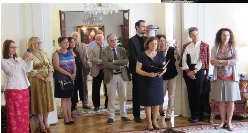
Momento del acto con parte del público asistente