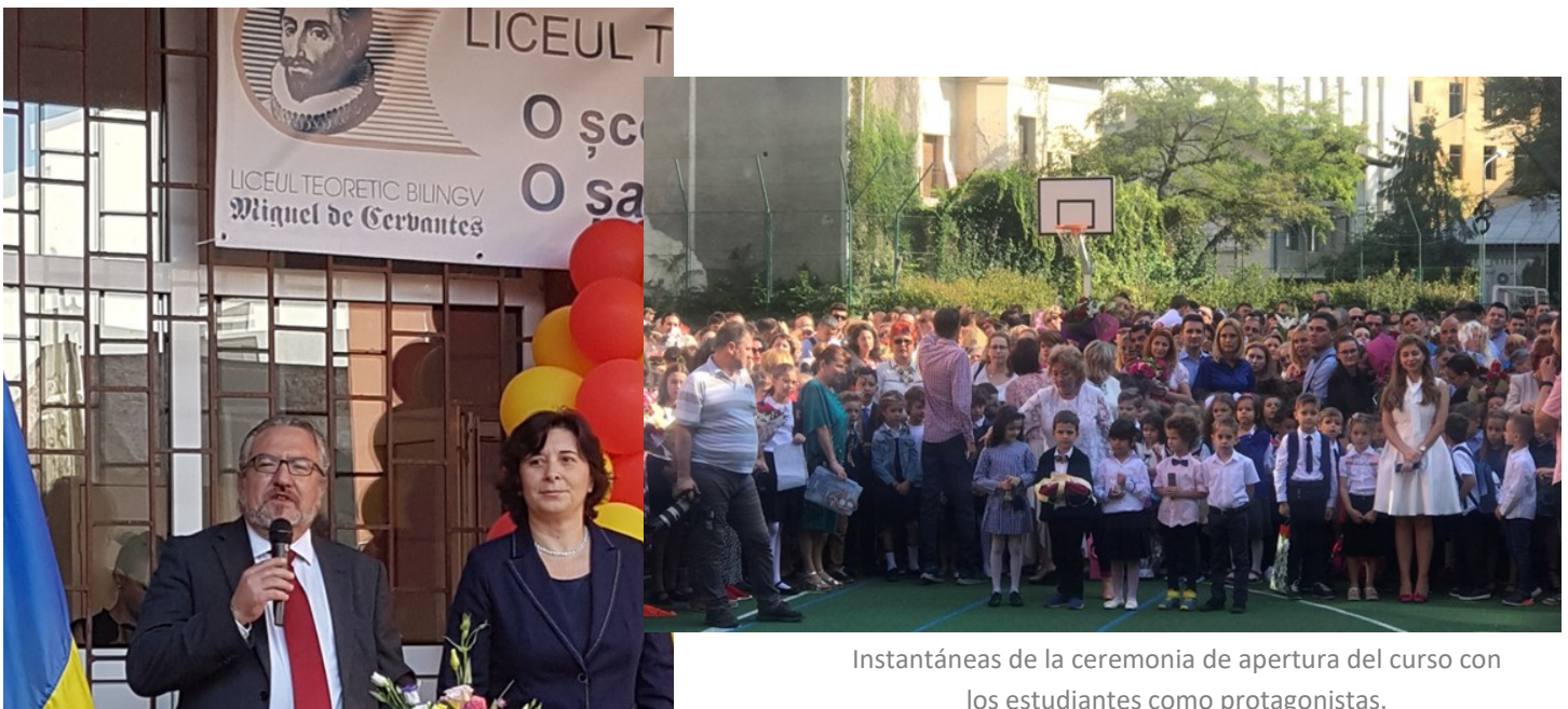
Instantáneas de la ceremonia de apertura del curso con los estudiantes como protagonistas.

Los actos de inauguración del curso académico son de una gran vistosidad y colorido. El cielo azul de Bucarest en estos días de finales de verano ayuda a darle aún más colorido si cabe a la ceremonia. Ésta consiste, básicamente, como se puede apreciar en las fotografías, en un desfile de los alumnos camino de sus clases, comenzando por los más pequeños, los de infantil, bajo un pasillo cubierto de ramos de flores que forman los padres al paso ordenado de los nerviosos estudiantes. Se trata de una tradición ancestral muy común en los países balcánicos, que añade un bonito componente de luz y color al importante día de comienzo del curso escolar, especialmente para aquellos que lo hacen por primera vez en su vida.