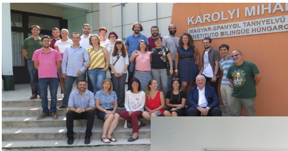
Foto de profesores y coordinadores de español en la Sección Bilingüe de Budapest.