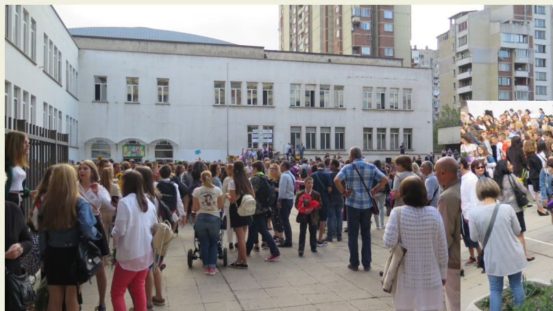
Diferentes momentos de la inauguración del curso escolar 2018/2019, en Bulgaria.