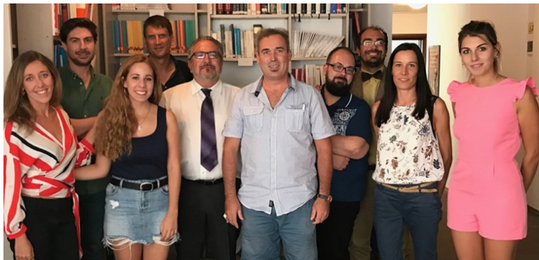
Profesores de las SSBB rumano-españolas junto al Agregado de Educación