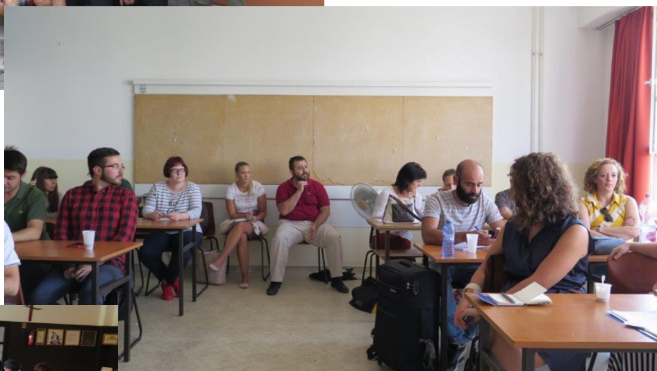
Comida de los asistentes aprovechando un intermedio de la reunión.