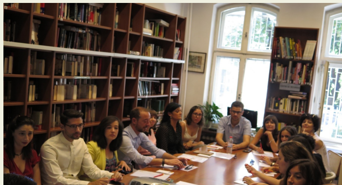
Profesorado de las Secciones Bilingües en Bulgaria, al inicio de la formación del Profesorado.

El pasado 14 de septiembre, tuvo lugar en la Consejería de Educación de Sofía la Jornada de Formación Inicial del Profesorado, que se enmarca dentro del plan anual de actividades de dicha Consejería. Este año, en Bulgaria, hay diecisiete profesores encargados de desempeñar sus funciones como docentes en el programa de Secciones Bilingües que el Ministerio de Educación y Formación Profesional tiene implantado en este país.