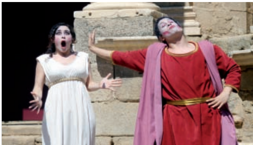
Aulularia, Mérida 2009.

mos más que agradecer a todos su participación en nuestra humilde historia. Y como es imposible citar a todos y todas en estas líneas queremos decir que sin su esfuerzo e ilusión hoy no estaríamos aquí.