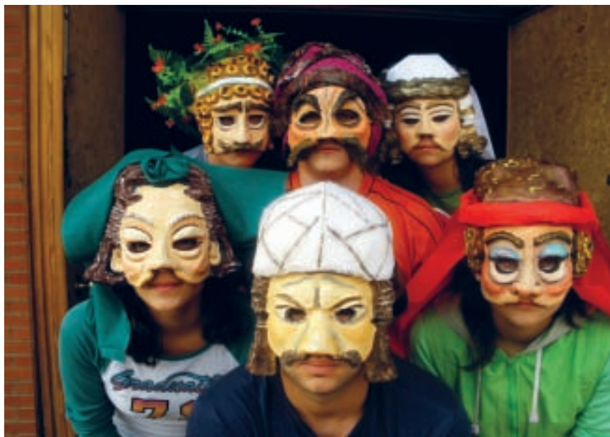
El gorgojo 2008. Teatro Romano de Segóbriga