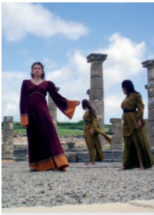
Rudens, Itálica 2010

épicos, epigráficos, textos de comedia, de tragedia, de lírica, de oratoria. Ninguna literatura sería comprensible sin autores como Menandro, Plauto, Cicerón, Sófocles, Safo, Catulo, Horacio.