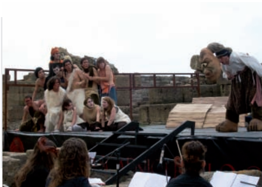
El Cíclope, Baelo Claudia 2009