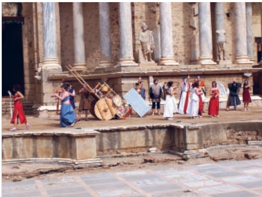
Aulularia 2006. Teatro Romano de Mérida