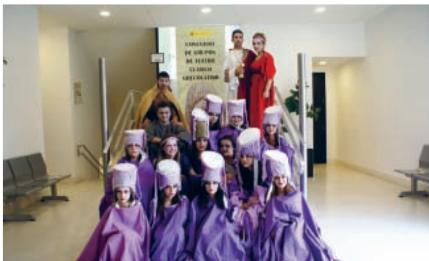
Electra 2010. Tarancón