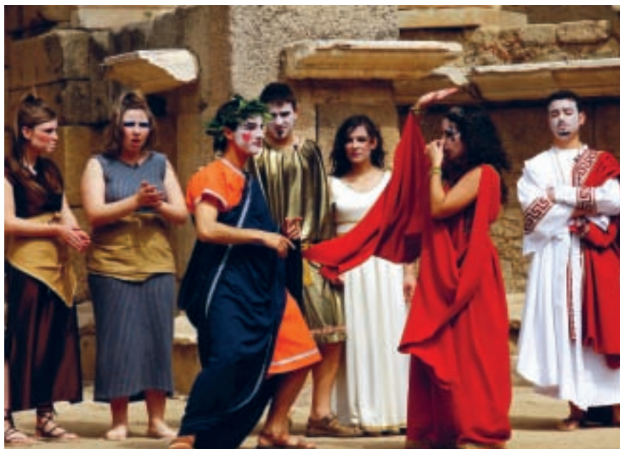
El eunuco 2007. Teatro Romano de Mérida