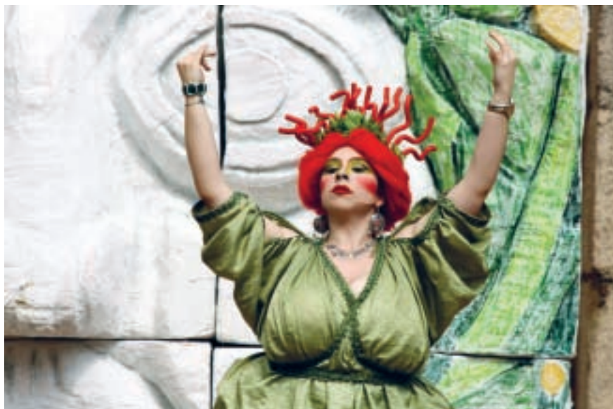
El sorteo de Casina 2010. Teatro Romano de Mérida