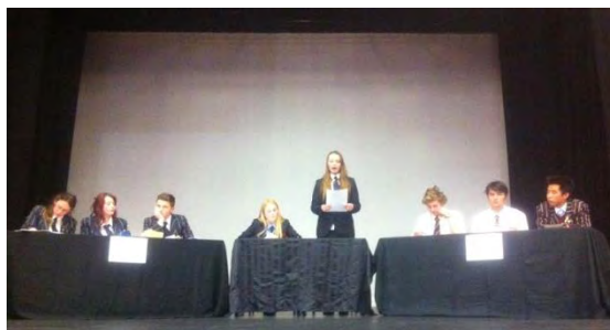
Presentación de la final

La jornada resultó muy interesante y participativa, destacando el gran papel de todas las escuelas en general, así como la igualdad entre los distintos equipos. De hecho, en la final hubo un empate técnico entre los equipos de Northcote College y Kings' College , por lo que hubo que consultar al comité de jueces para determinar el campeón, el cual resultó ser Kings's College, por lo cual organizarán la final del año 2016.