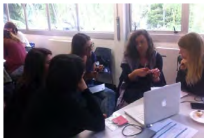
Auxiliares de conversación en plena sesión de trabajo