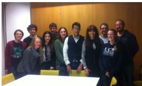
Auxiliares de Christchurch