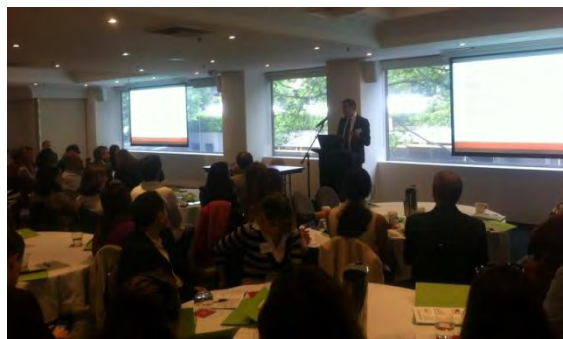
Una de las presentaciones del congreso de NGS

El congreso, celebrado en el Hotel Rydges de Sydney, resultó un gran éxito, y contó con la presencia de destacados ponentes de distintos países. La participación superó la cifra de cincuenta profesores de español de NSW.