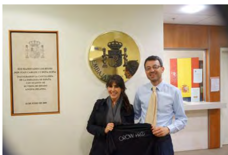
La directora de Grow Pro NZ con el ATD

Otra de las colaboraciones que viene ofreciendo la Consejería de Educación es con una joven empresa española creada este año 2015 y cuyo objetivo es ayudar gratuitamente a ciudadanos españoles que desean vivir en Nueva Zelanda. Desde la Consejería se les ofrece asesoramiento sobre aspectos educativos de diversa índole.