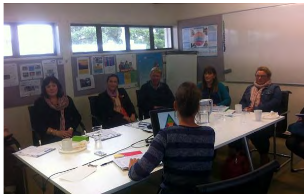
Participantes en la sesión de orientación

En el año 2012, ante la cancelación de los cursos de verano que anualmente organizaba la SGCI y para cubrir el vacío que estos dejaban, la Consejería ofreció al Ministerio de Educación neozelandés la posibilidad de organizar un programa de becas para los profesores de español de este país teniendo en cuenta las peculiaridades del calendario del hemisferio sur y las necesidades específicas de los docentes. La primera edición se celebró en abril 2013 y en ella participaron catorce profesores. En el 2014 el programa se desarrolló en julio, al igual que este año. En las dos primeras ediciones los resultados han sido excelentes, motivo por el cual el Ministerio ha decidido prorrogar el programa un año más, a pesar de la reapertura de los cursos de verano por parte del MECD y que se celebran en la UIMP.