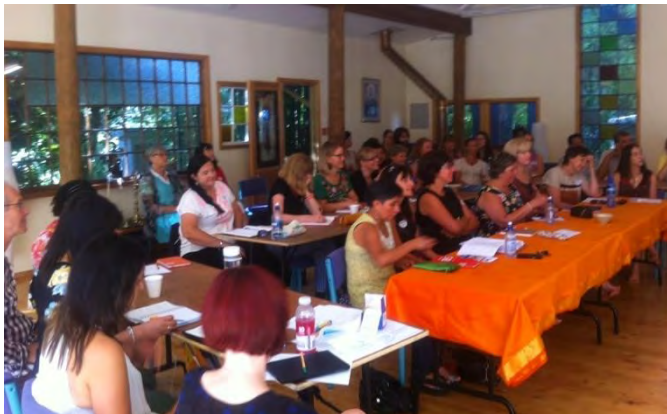
Participantes de las jornadas

Durante los días 20 y 21 de febrero se celebró el tradicional fin de semana de Inmersión lingüística que anualmente organiza con mucho éxito STANZA, la Asociación de Profesores de Español en Nueva Zelanda Aotearoa, con la cual la Consejería de Educación tiene un convenio de cooperación firmado en el año 2013. En virtud de ese convenio, la cooperación entre ambas instituciones es muy estrecha. Uno de los múltiples ejemplos es la participación de la Consejería en estas jornadas.