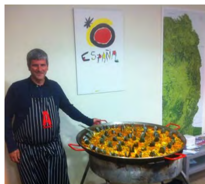
Cocinero y paella

Durante el taller, tres profesores que habían sido becados para realizar un curso de inmersión en la Universidad de Salamanca durante el verano (ver página 16) compartieron actividades de éxito en la clase de ELE que han desarrollado a partir de su estancia en Salamanca. La actividad concluyó con un acto social en el que los participantes disfrutaron de una succulenta paella elaborada durante la celebración del taller.