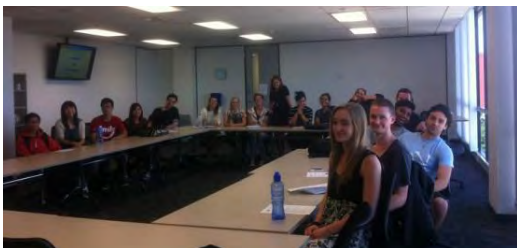
Estudiantes de AUT

En el resto de universidades del país, Massey, Otago y Canterbury, la difusión se realizó a través de los profesores del departamento de español obteniendo unos resultados desiguales, por lo que en aquellas en las que ha habido un menor número de solicitudes se intensificará la difusión con reuniones presenciales el año 2016.