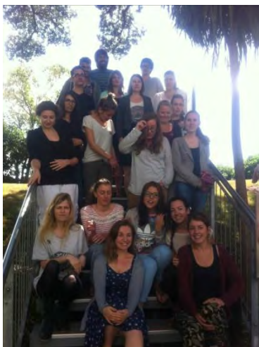
Clausura de las jornadas

Antes de clausurar las jornadas, se realizó una foto de grupo en las escaleras del Kohia TC de la Facultad de Educación y, posteriormente, los auxiliares fueron recogidos por los responsables de las distintas escuelas en las que van a trabajar durante el curso 2015.