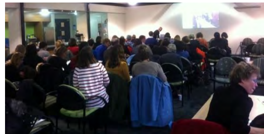
Asistentes al Langsem de Canterbury

La conferencia regional para profesores de lenguas extranjeras de Waikato, destacó por sus contenidos de carácter cultural tal y como se puede observar por los títulos de las siguientes ponencias: Cine e historia: estrategias didácticas para enseñar la historia española y latinoamericana , Connecting Latin America to New Zealand: history, geography, language and cultural similarities y The use of Flickr to generate storytelling .