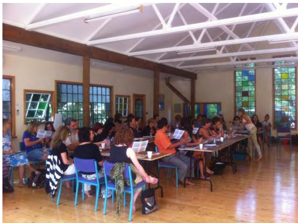
Asistentes realizando una de las actividades

Sin ninguna duda podemos afirmar que estas jornadas resultaron un gran éxito y fueron muy productivas para todos los participantes. Los resultados de las evaluaciones así lo ratificaron.