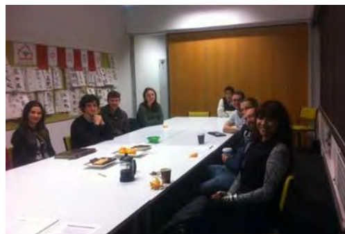
Auxiliares al inicio de una de la reuniones

Uno de los programas a los que la Consejería dedica mayor atención es el de auxiliares de conversación neozelandeses en España, el cual, como ya hemos indicado anteriormente, ha alcanzado estos últimos años unas cuotas de participación muy notables gracias, entre otras iniciativas, a la firma de convenios con las universidades neozelandesas que ofertan español.