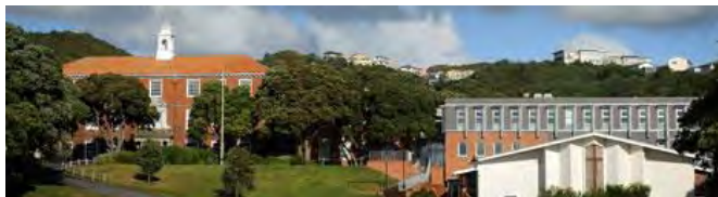
Scots College en Wellington

Cada año se visitan cerca de treinta centros educativos repartidos por todo el país. Algunas de las escuelas visitadas durante el 2015 que podemos mencionar son las siguientes: Wellington College, Takapuna Grammar, Massey High School, ACG Strathallan College, Hillcrest High School, Scots College, Botany Downs Secondary College, Christchurch Girls' High School, Aorere College, Auckland Grammar, Kings College, Pakuranga College, Westlake Girls College Rangi Ruru Girls' School o Rangitoto College.