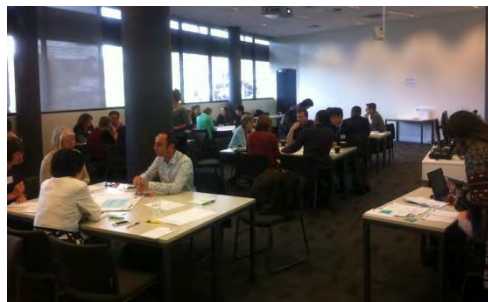
Grupos de trabajo de asistentes

Bajo el lema Is the future of learning languages in New Zealand all black? , la jornada, desarrollada con un ritmo muy intenso, resultó muy práctica y los participantes mostraron mucho entusiasmo a la hora de apoyar distintas iniciativas. La idea de que todas las lenguas cooperen juntas para lograr un objetivo común fue una de las conclusiones más destacadas. Igualmente se crearon grupos de trabajo para determinar las próximas actuaciones. La Consejería de Educación jugó un destacado papel en la celebración de esta conferencia.