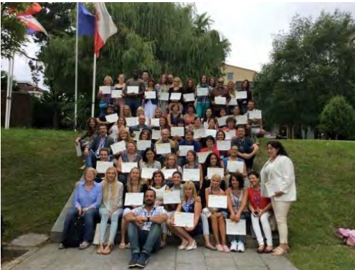
Participantes en los cursos de la UIMP

Por su parte, otros cuatro profesores neozelandeses participaron en dos cursos de verano organizados por la UIMP, en el marco del programa anual que gestiona el MECD. Una profesora participó en el curso Recursos digitales en el aula de ELE, el cual tuvo una duración de una semana, y otras tres se inscribieron en el curso denominado Entornos virtuales en la enseñanza de ELE, el cual tuvo una duración de dos semanas.