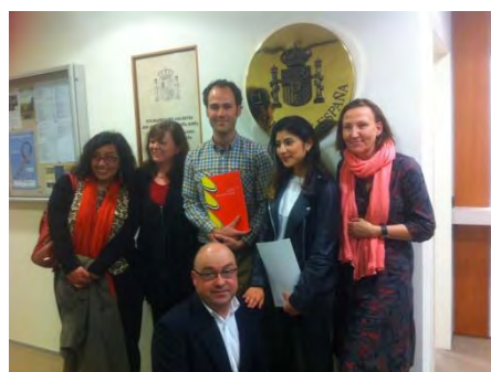
Alumnos premiados y profesores de UVW

Igualmente se ofreció a ambos ganadores la posibilidad de participar en el programa de auxiliares de conversación en España durante el curso 2016-2017, hecho que les resultó especialmente interesante, por lo que probablemente los tengamos en nuestro país el año que viene.