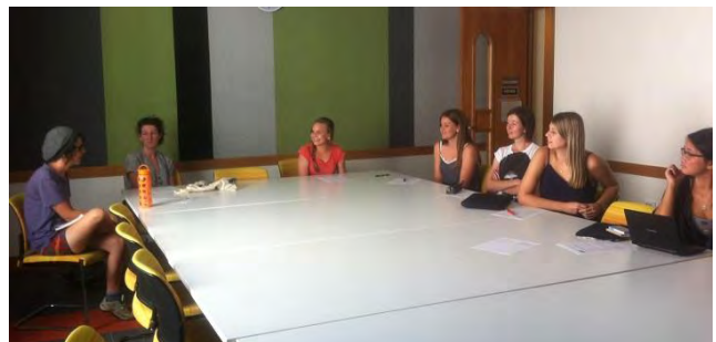
Estudiantes de la Universidad de Auckland

Teniendo en cuenta este número de solicitudes recibidas, muy similar al del año pasado, podemos afirmar que el programa está perfectamente consolidado, destacando una ratio muy elevada de candidatos admitidos por número de habitantes.