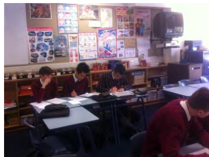
Alumnos de Kings College

Para más información sobre esta actividad: http://www.stanza.org.nz/term-2/