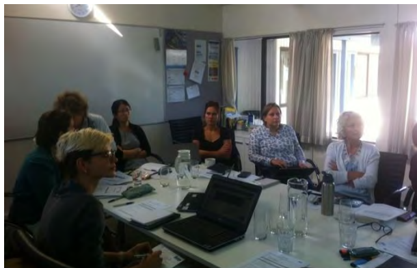
Miembros del equipo de ILEP

El ATD de la Consejería de Educación colabora anualmente con ILEP en calidad de National Adviser for Spanish .