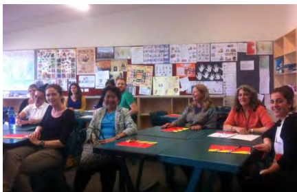
Profesores de Christchurch

Durante la segunda quincena del mes de octubre, la Consejería de Educación, en colaboración con ILEP y la Universidad de Canterbury, organizó dos actividades de formación para profesores de español.