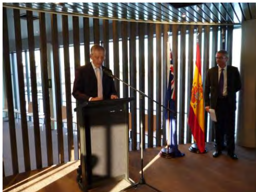
El Embajador de España

La fiesta resultó un gran éxito y contó con la presencia de destacadas personalidades, en especial del ámbito político, gubernamental y diplomático.