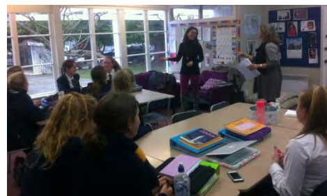
Alumnas de español de Rangi Ruru

Durante la jornada de trabajo hubo oportunidad de visitar distintas clases de ese centro y departir con las estudiantes de español, las cuales demostraron un gran entusiasmo por aprender nuestra lengua.