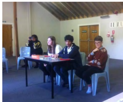
Alumnos participantes en el concurso