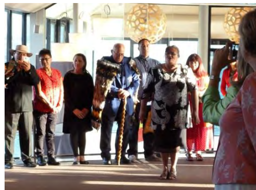
Grupo de Panioras dando la bienvenida maorí