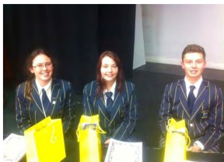
Alumnos de Northcote College