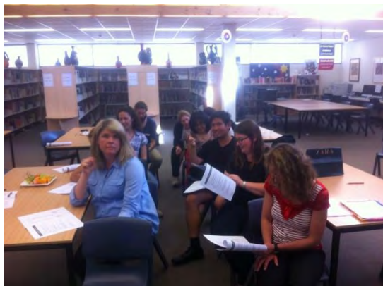
Asistentes al taller de Canberra

Los días 21 y 23 de octubre, el ATD de la Consejería participó en dos actividades de formación que tuvieron lugar en Australia y que fueron organizadas por sus colegas de la Consejería en Canberra.