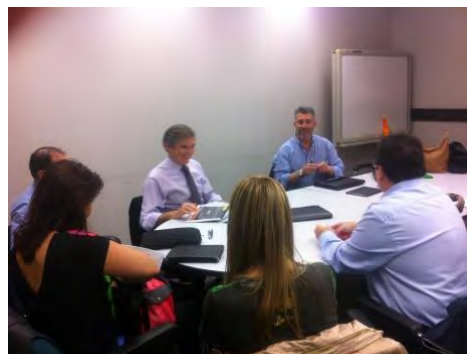
Asistentes a las jornadas