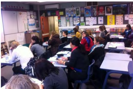
Asistentes al Langsem de Otago

En general fueron unas ponencias interesantes y, además, hubo oportunidad de departir con los profesores de español y conocer a algunos nuevos. La última parte de la conferencia consistió en la impartición de una ponencia por parte del ATD de la Consejería titulada Un viaje sin fin: de España a Nueva Zelanda, pasando por Latinoamérica , la cual versó, lógicamente, sobre los movimientos migratorios en España y su impacto en Iberoamérica y Nueva Zelanda. El contenido de esta presentación fue solicitado en su momento por los organizadores de la conferencia.