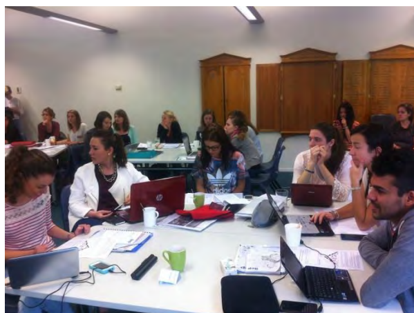
Auxiliares españoles durante una de las sesiones

La segunda jornada se dedicó a hablar sobre los salarios, impuestos, asistencia médica, así como cuestiones relacionadas con su actividad dentro del aula: recursos, nuevas tecnologías, etc.