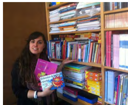
Nuevos fondos incorporados

En el año 2013 se firmó un acuerdo para la creación de una sucursal del Centro de recursos Alejandro Malaspina de Canberra en la sede de ILEP en la Facultad de Educación de la Universidad de Auckland. Desde ese año se ha venido trabajando para aumentar los fondos ya existentes y fomentar el uso de los mismos entre los profesores de español del país. Como hecho más destacado este año cabe mencionar que esta Consejería consiguió una donación para esta sucursal en el mes de septiembre. Cerca de quinientas nuevas obras, por valor de 20.000 dólares, fueron incorporadas a los fondos.