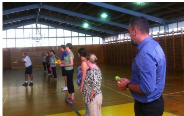
Participantes en el taller atendiendo las instrucciones de la sesión práctica

Más información sobre este taller: http://www.ilep.ac.nz/about/news-and-events