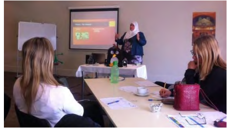
Sesión de español en Hamilton, Waikato

Este año de 2015, la Consejería ha colaborado en las de Auckland, Waikato, Canterbury y Otago. Estas dos últimas en la isla sur.