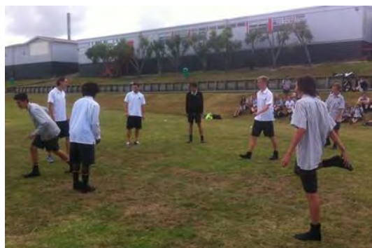
Estudiantes de Massey HS entrenándose

La visita resultó muy interesante y tanto alumnos como jugadores disfrutaron mucho de la misma, por lo que está previsto seguir organizando esta actividad en Auckland y en Wellington durante la segunda mitad de año, así como en el 2016, siempre y cuando haya jugadores disponibles.