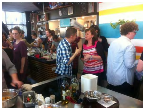
Alumnos y profesores durante la actividad

Como parte de la colaboración de la Consejería de Educación con la Universidad Victoria de Wellington, el día 15 de octubre el ATD de la Consejería participó como juez en un concurso de cocina internacional organizado por la mencionada Universidad.