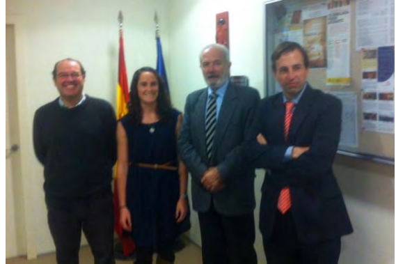
El Embajador de España con una de las becarias

Entre los distintos programas que se desarrollan conjuntamente cabe destacar el de becarios que realizan prácticas en la Embajada de España y que fue puesto en marcha gracias a la Consejería de Educación. A través de este programa, estudiantes de excelencia académica (VILP) de la Universidad tienen la posibilidad, a través de estas prácticas, de conocer de primera mano en qué consiste el trabajo en una misión diplomática.