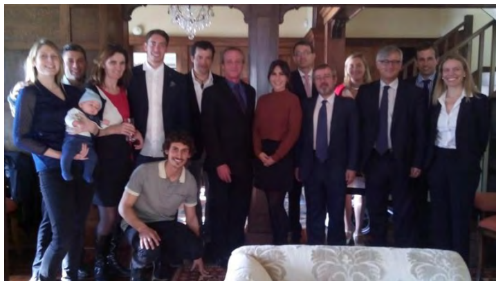
Asistentes a la recepción