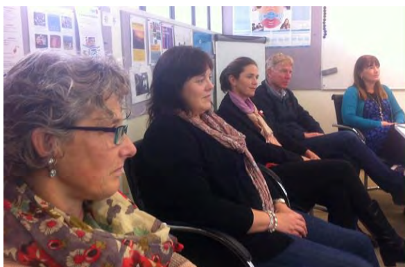
Cinco de los diez profesores becados

Para el programa de cursos de verano en la UIMP han sido seleccionados cuatro profesores neozelandeses, de los cuales tres realizarán un curso de dos semanas, mientras que el cuarto participante realizará un curso de una semana.