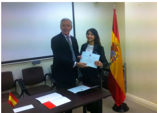
El Embajador entregando uno de los diplomas

El día 27 de octubre a las 12:30 se celebró en la sede de la Embajada de España en Wellington la ceremonia de entrega del premio del concurso de ensayos Embajada de España , organizado conjuntamente por la Consejería de Educación de la Embajada y la Universidad Victoria de Wellington.