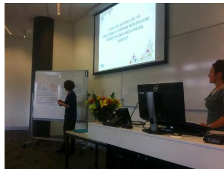
Uno de los presentadores de ILEP

El día 19 de septiembre se celebró en la Escuela de Negocios de la Universidad de Auckland la conferencia denominada ILEP Summit en la que participaron las instituciones más relevantes en materia de enseñanza de lenguas extranjeras (universidades, asociaciones de lenguas, organismos oficiales, embajadas, etc.) de Nueva Zelanda con objeto de estudiar la situación actual de las lenguas extranjeras en este país e impulsar el estudio de las mismas a través de distintas acciones encaminadas a concienciar a la población y al gobierno.