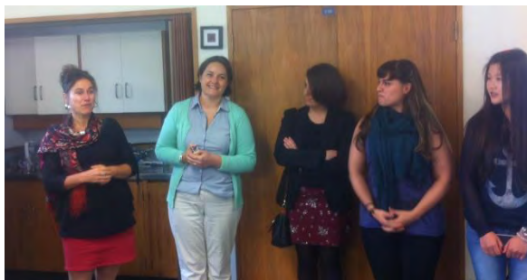
Bienvenida de los miembros de ILEP