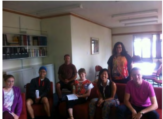
Estudiantes de la Universidad Victoria

Dado que el curso académico en este país comienza a mediados o finales del mes de febrero, la mayor parte de la difusión de este programa se hace a partir de esa fecha, de ahí que las reuniones informativas se concentren en el mes de marzo.