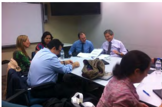
Asistentes a las jornadas

En estas jornadas participaron la Secretaria General de la Consejería, los cuatro ATDs adscritos a la misma (Australia, Filipinas y Nueva Zelanda) y todo el personal docente de la ALCE de Australia.