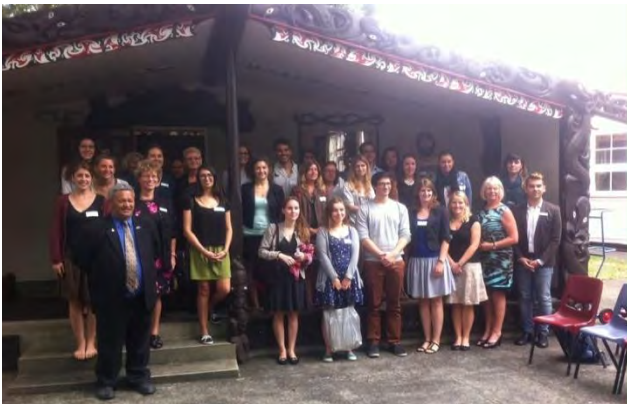
Auxiliares en el Marae tras el Powhiri

Los días 9 y 10 de febrero se celebraron en la facultad de educación de la Universidad de Auckland las jornadas de orientación para auxiliares de conversación españoles en Nueva Zelanda durante el curso 2015. Estas jornadas fueron organizadas conjuntamente por la Consejería de Educación y ILEP, organismo dependiente del Ministerio de Educación de Nueva Zelanda, encargado de apoyar los programas de lenguas extranjeras en el país.