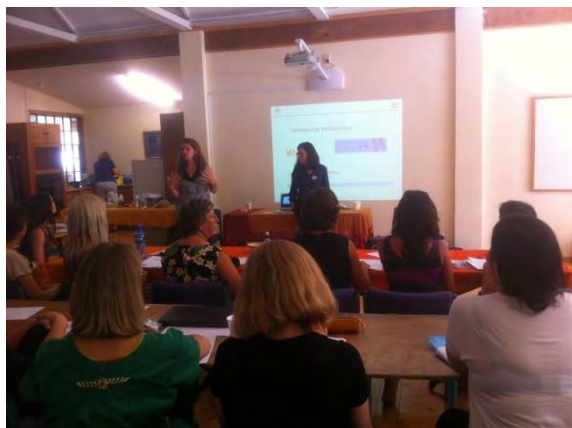
La vicepresidenta de STANZA abriendo una sesión

Por parte de la Consejería, se hizo una presentación de los distintos programas de los que los profesores de español de Nueva Zelanda se pueden beneficiar: centro de recursos, cursos de verano, programa de becas, talleres de formación, auxiliares de conversación, visitas a escuelas, etc.