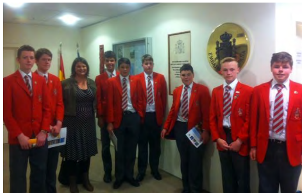
Alumnos de Lindisfarne College y su profesora

El día 16 octubre, la Embajada de España recibió la visita de un grupo de estudiantes de español de la escuela Lindisfarne College, de la localidad de Hastings, en la región de Hawkes Bay, al este de la isla norte.