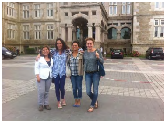
Participantes neozelandesas. UIMP 2016

El curso de la USAL está abierto a cualquier adulto durante casi todo el año, mientras que el de la UIMP es específico para profesores de español y se realiza en unas semanas específicas.