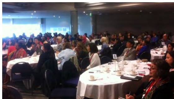
Asistentes a la conferencia

revisaron los diferentes puntos de vista del Gobierno neozelandés sobre la política de lenguas extranjeras en este país. La Consejería de Educación participó de manera muy activa en las distintas ponencias que dieron contenido a estas dos interesantes jornadas inauguradas por el Ministro Sam Lotu-liga.