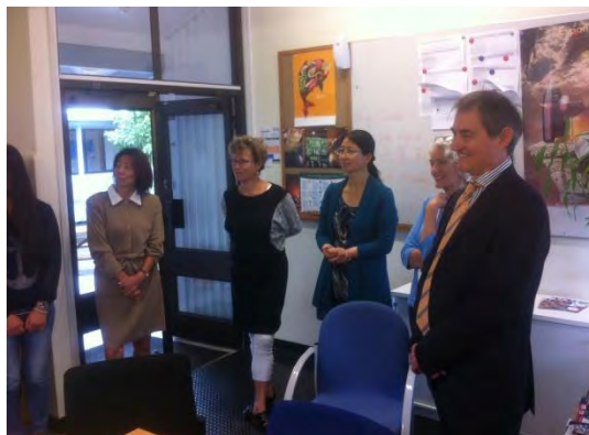
El Sr. Consejero con miembros de ILEP