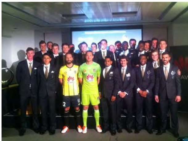
Plantilla de los Phoenix para la temporada 2015-16

Con motivo de la apertura oficial de la temporada 2015-2016 de la liga de fútbol profesional de Australia/Nueva Zelanda, el día 10 de septiembre a las 18:30, se celebró en el Custom House Quay Building , de la ciudad de Wellington, un acto institucional organizado por el equipo profesional de los Wellington Phoenix, con el cual esta Consejería de Educación desarrolla distintos programas de cooperación desde hace varios años, destacando el de español y fútbol , el cual se menciona en la página siete de este boletín.