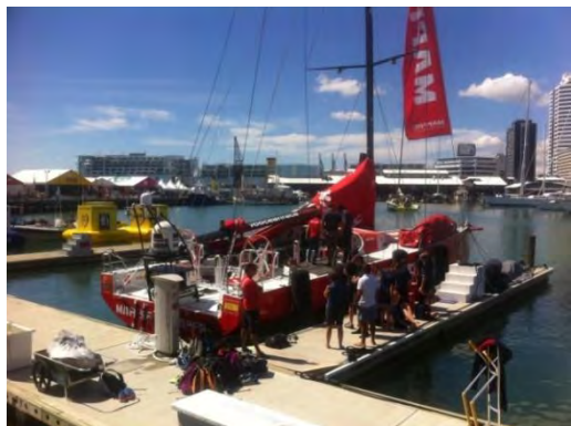
Embarcación en el puerto de Auckland

El día 12 de marzo, aprovechando la presencia del barco español MAPFRE que estaba participando en la Volvo Ocean Race y que acababa de ganar la etapa entre China-Nueva Zelanda, el ATD de la Consejería realizó una visita al equipo español para saludarles en nombre del Embajador, felicitarles por la victoria obtenida en la etapa y para desearles mucha suerte en el resto de la competición.