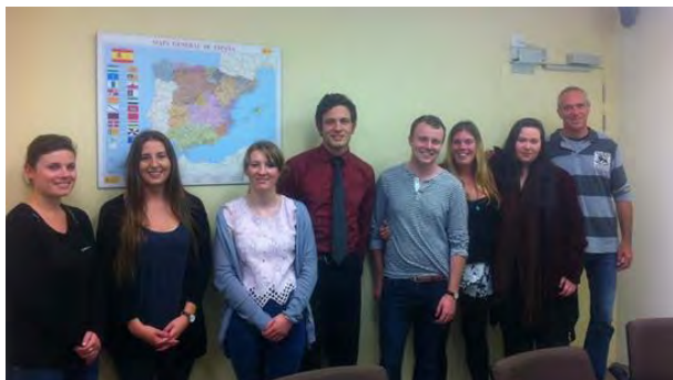
Auxiliares en la reunión de Wellington

Uno de los programas a los que la Consejería dedica mayor atención es el de auxiliares de conversación neozelandeses en España, el cual, como ya hemos indicado anteriormente, ha alcanzado estos últimos años unas cuotas de participación muy notables gracias, entre otras iniciativas, a la firma de convenios con las universidades neozelandesas que ofertan español.