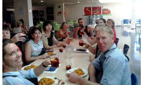
Profesores becados comiendo paella

En el caso del programa de becas para realizar un curso de dos semanas a principios del mes de julio en la Universidad de Salamanca se seleccionaron diez profesores de distintas localidades del país. Antes de desplazarse a España, estos profesores participaron en una jornada de orientación co-organizada por la Consejería y de la cual ya hemos informado en la página 10 de este boletín. La estancia en la ciudad de Salamanca resultó todo un éxito, al igual que la participación en el curso organizado por la Universidad. Las evaluaciones que realizaron los profesores a su regreso a Nueva Zelanda constatan este extremo, motivo por el cual el Ministerio de Educación de este país ha decidido volver a ofrecer este programa, el cual se coordina directamente desde la Consejería de Educación.