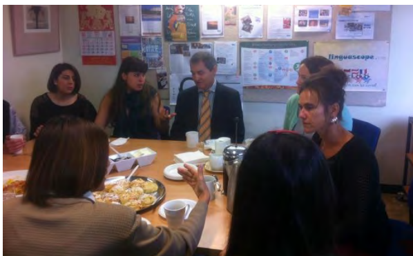
El Sr. Consejero departiendo con la nueva auxiliar