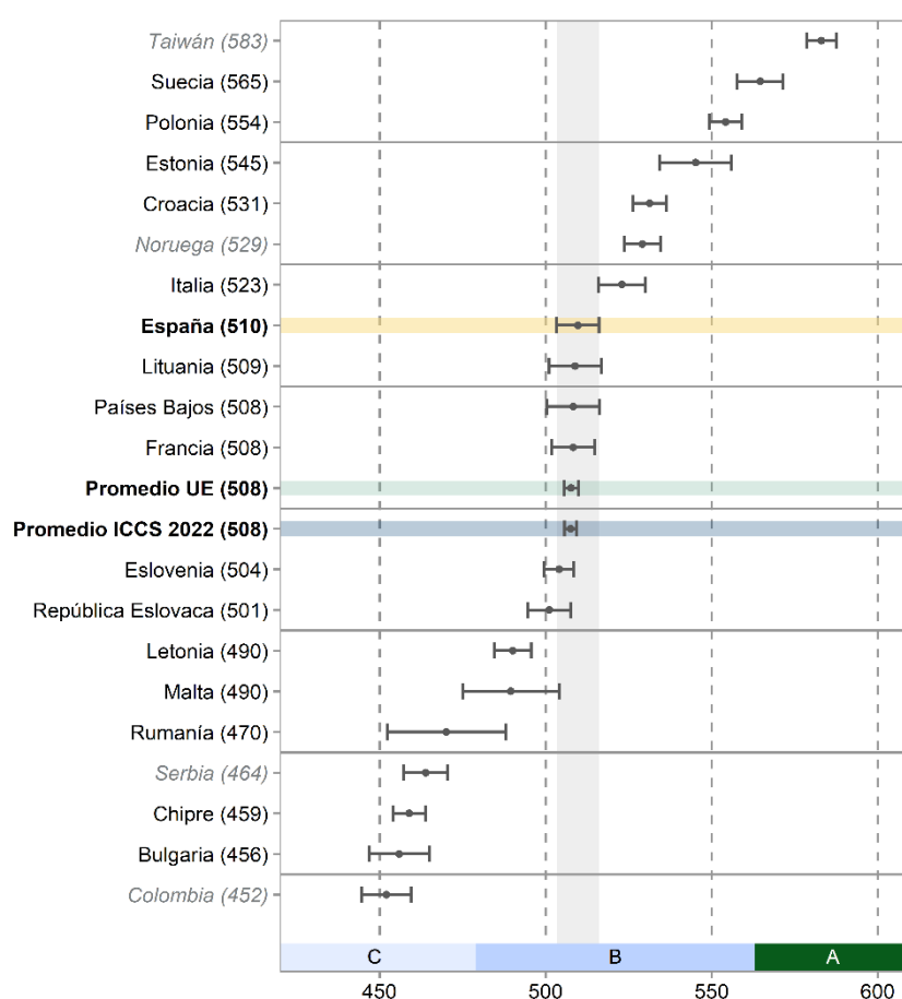
FIGURA 2. Puntuaciones medias estimadas en competencia cívica y ciudadana e intervalos de confianza al 95 % de los países participantes en ICCS 2022

Taiwán destaca como el país que ha obtenido el mayor rendimiento medio estimado (583 puntos) en competencia cívica y ciudadana, mientras que la puntuación más baja se ha registrado en Colombia (452). De entre los países pertenecientes a la UE, merece la pena destacar la alta puntuación obtenida por Suecia (565 puntos), mientras que el peor registro europeo ha sido el de Bulgaria (456 puntos). España se coloca en octava posición en la escala de rendimiento, y es el sexto país de la UE con mejor puntuación en competencia cívico-ciudadana.