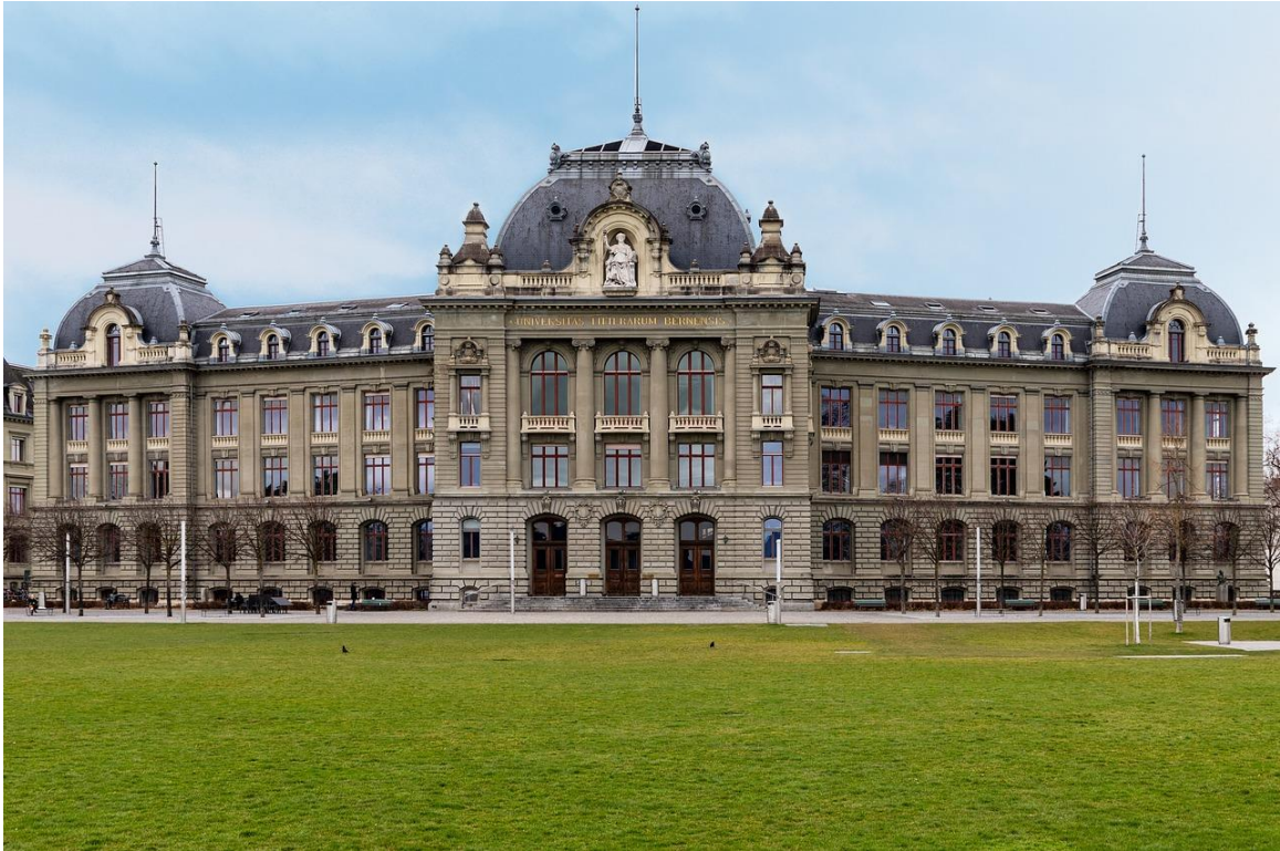
Fachada principal. Universidad de Berna

Por lo que se refiere a las instituciones universitarias propiamente dichas, estas en Suiza se tipifican del modo siguiente: