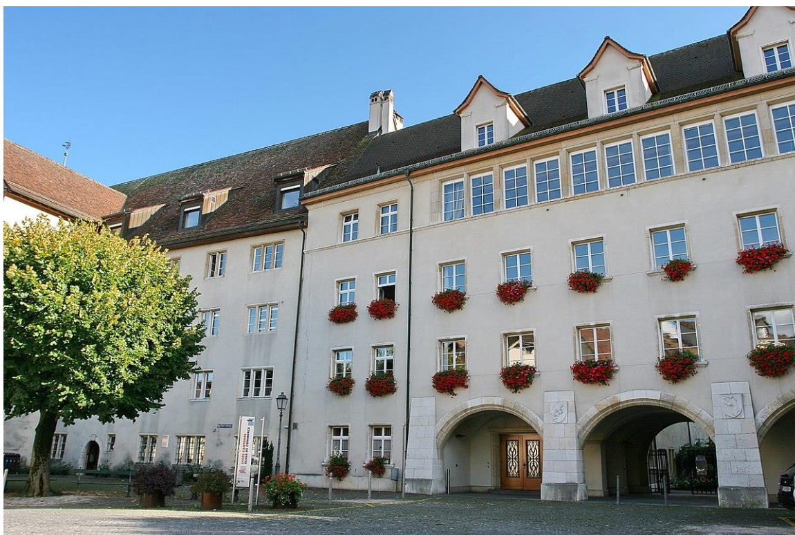
Lycée Cantonal de Porrentruy

llevar la responsabilidad de un curso. La situación puede variar en gran medida en función del centro y del cantón en el que desarrolle su labor.