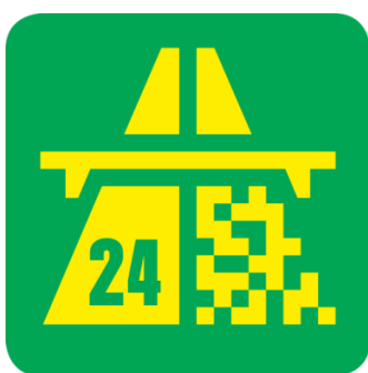
Viñeta para el año 2024

La circulación interurbana goza de una cuidada red de carreteras y autopistas; estas últimas unen fundamentalmente las principales ciudades, aunque no atraviesan los pasos alpinos. Para la circulación por las autopistas hay que pagar anualmente un impuesto de 40CHF que se materializa en una viñeta-pegatina que está en venta en las aduanas, gasolineras, oficinas de correos y kioscos (una por cada vehículo o remolque) En España se pueden adquirir en las oficinas del Real Auto-club de España “RACE” . La velocidad máxima en las carreteras es de 80 Km/h y en las autopistas de 120 Km/h (con numerosos tramos con un límite inferior).