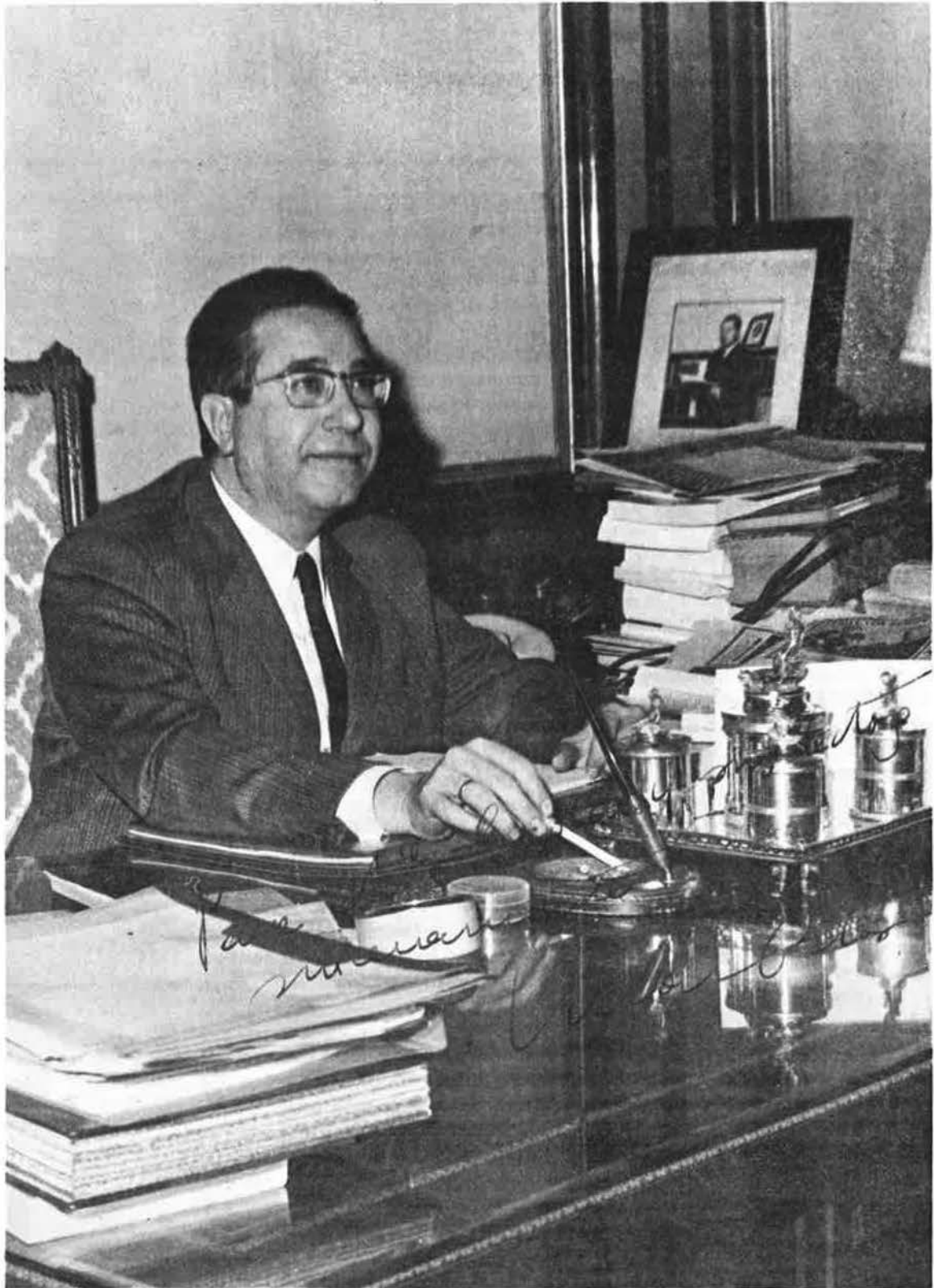
EXCELENTISIMO SR. MINISTRO DE EDUCACION Y CIENCIA: Dr. Don José Luis Villar Palasi