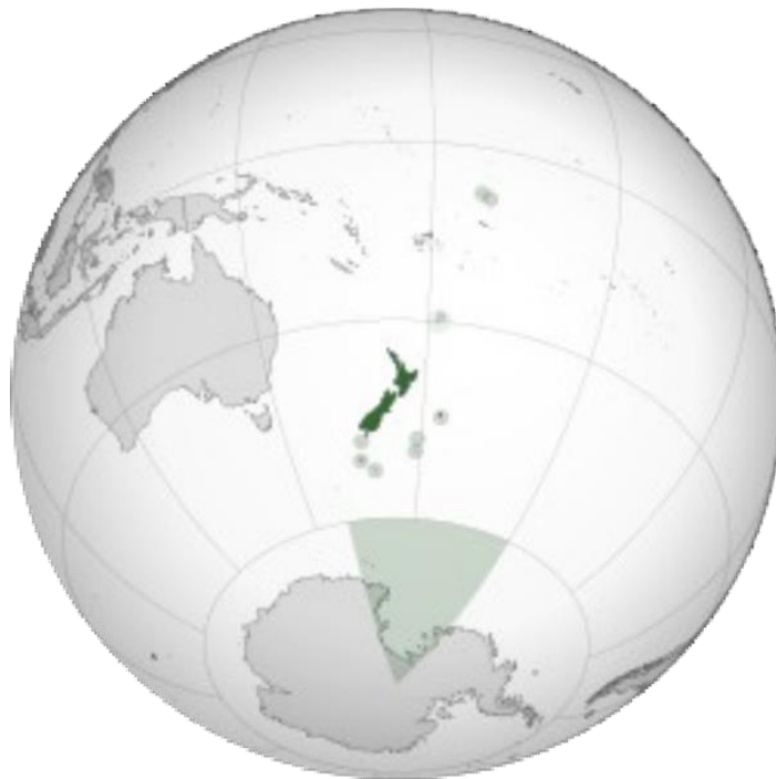
Imagen: Mapa geográfico de Nueva Zelanda de Wikipedia