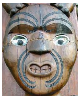
Te auote whenua

Actividades de servicio a la comunidad: trabajar en el hospital, ayudar a leer a niños, etc.