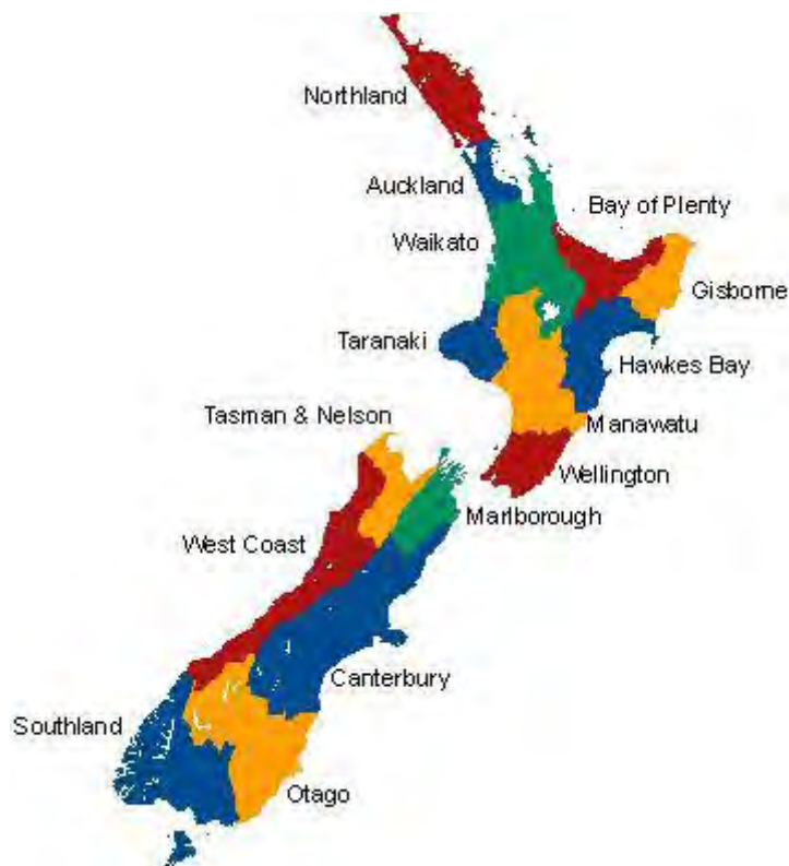
Divisiones regionales de Nueva Zelanda

Bienvenidos a Aotearoa, Kia ora y ¡mucho suerte en Nueva Zelanda!