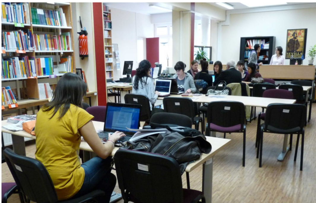
Auxiliares de conversación trabajando en el Centro de Recursos Didácticos