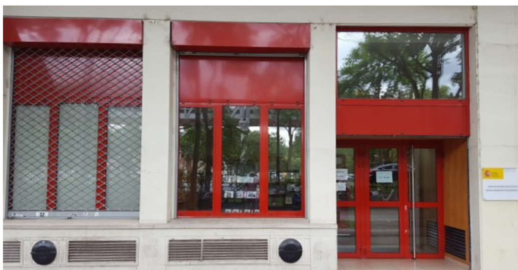
Fachada del Centro de Recursos Didácticos