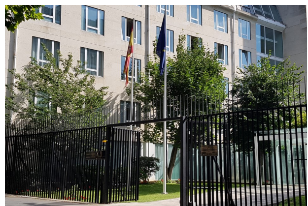
La Embajada de España, donde tiene su sede la Consejería de Educación

Si se desea información complementaria, se puede contactar con el Centro de Recursos Didácticos de la Consejería de Educación por teléfono (01 47 07 48 58) o por correo electrónico: centrorecursos.fr@educacion.gob.es